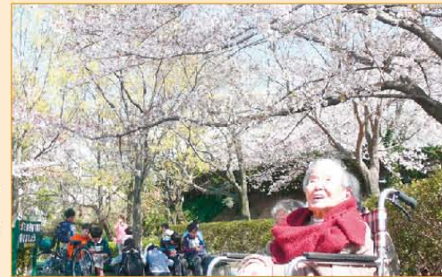
桜咲く『お花見』の季節ですね♪ポカポカと天気の良い日は公園までお散歩にいきませんか？