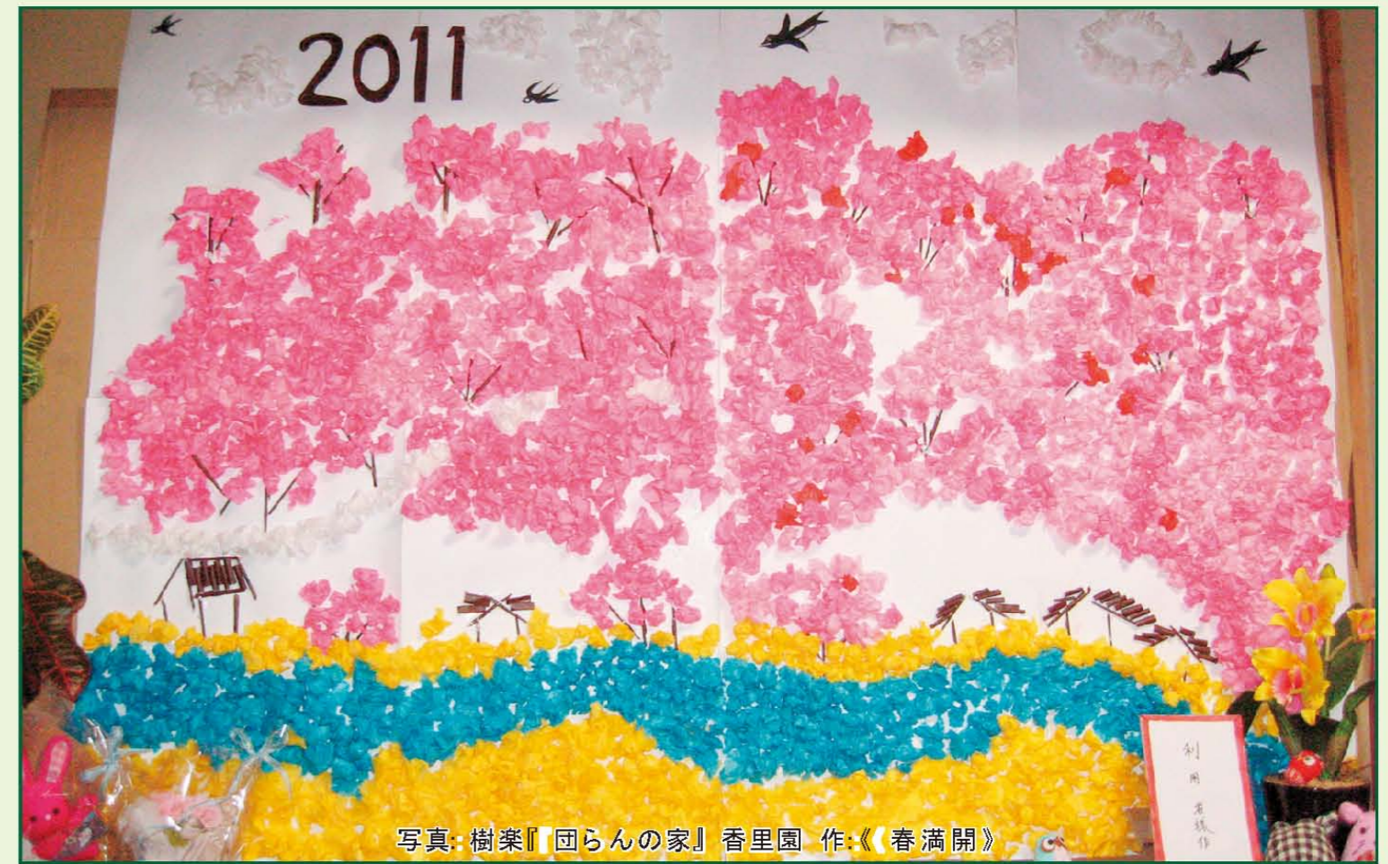
写真: 樹楽『団らの家』香里園 作: 《春満開》