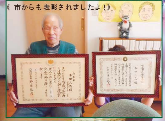
写真「上寿：100歳のお誕生日」樹楽『団らんの家』白石