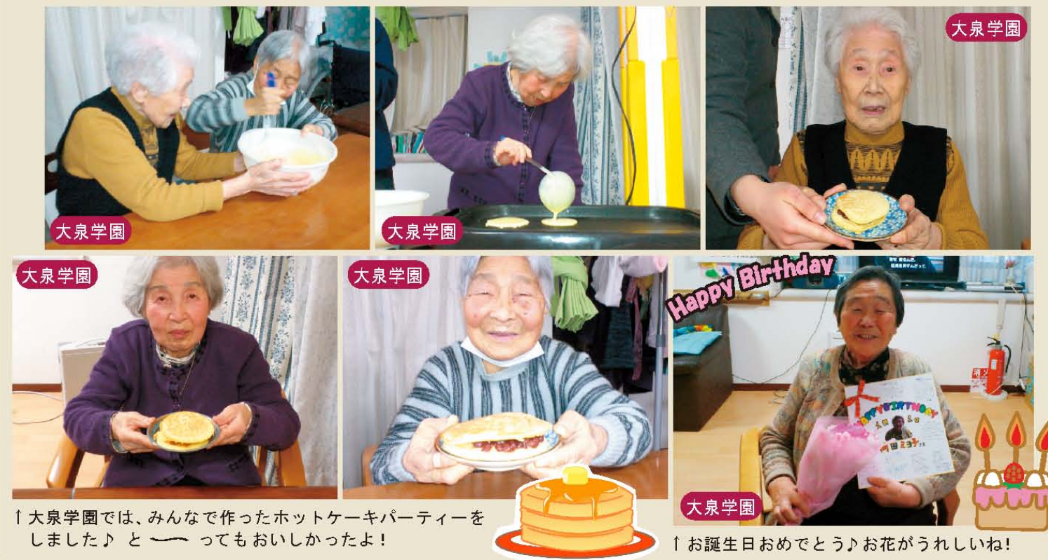
↑運動のあとは自然と笑顔もさわやか◎ ↑どう?春らしい飾りでしょ! ↑西の宮のお正月は、みんなでパーティー♪ ↑ジャンジャカ♪門真と門真東の紅白歌合戦(笑)↑ ↑美人さん揃いでハイチーズ!! ↑大泉学園では、みんなで作ったホットケーキパーティーをしました♪とーってもおいしかったよ! ↑お誕生日おめでとう♪お花がうれしいね!