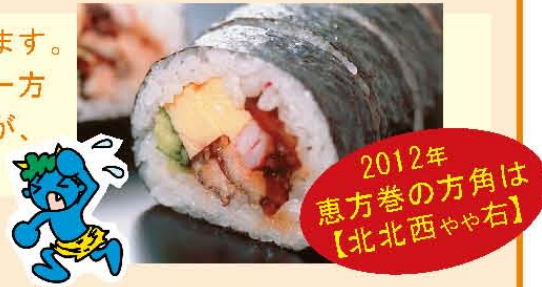
2012年 恵方巻の方角は【北北西やち右】