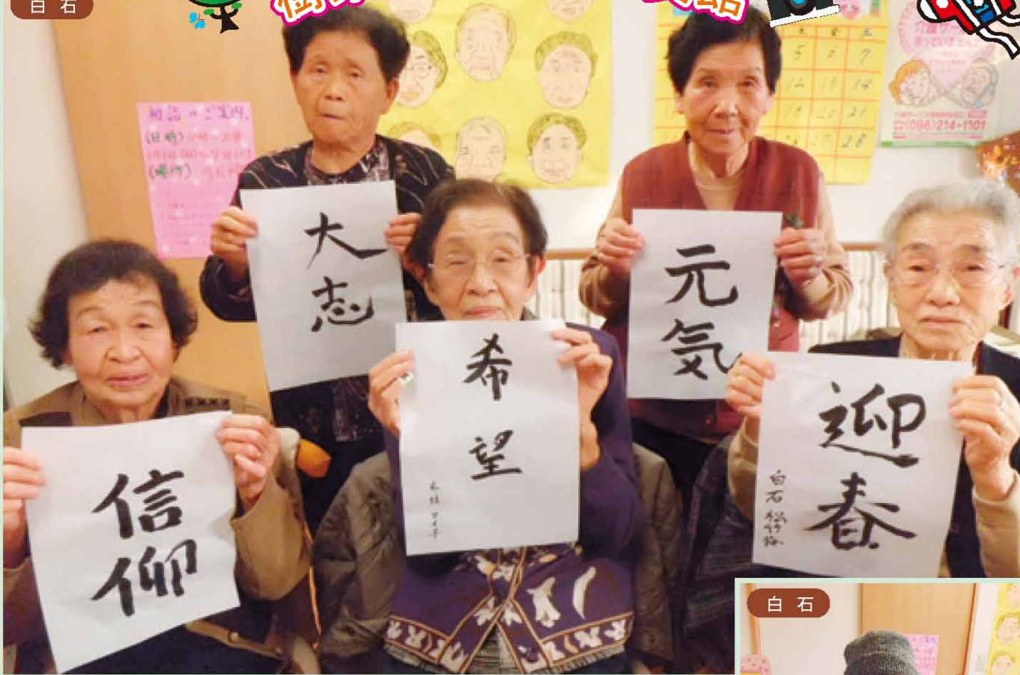
↑目標や願いは各自違えど、2012年も楽しく良い年でありますように!!