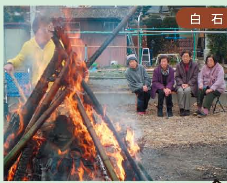
↑願いよ叶え! 「どんど焼き」