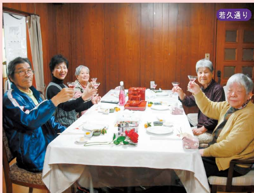
↑若久通りのお正月! はい、みなさんグラスを手に…乾杯!