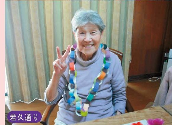
↑やっぱり誕生日ってうれしいね!