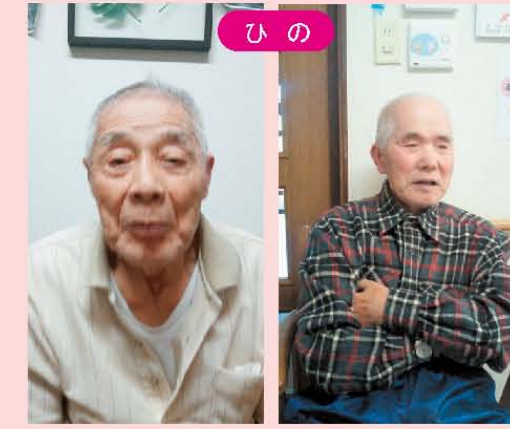
↑ひのは今日ものんびり居心地いいね!