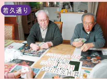
↑七並べ…みんな真剣です(^.^); ←みんなで大晦日の大掃除!!