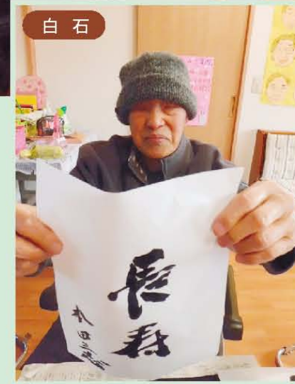
↑まだまだ人生笑って楽しみたい!