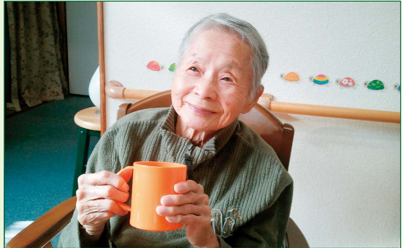
写真《暖かなひだまりの午後》樹楽『団らの家』ひの

社団法人 日本フランチャイズチェーン協会 正会員 社団法人 大阪府介護保険経営者連絡協議会 正会員 〒564-0053 大阪府吹田市江の木町17-1 コンパノビル 8F TEL. 06-6339-8400 FAX 06-6339-5678