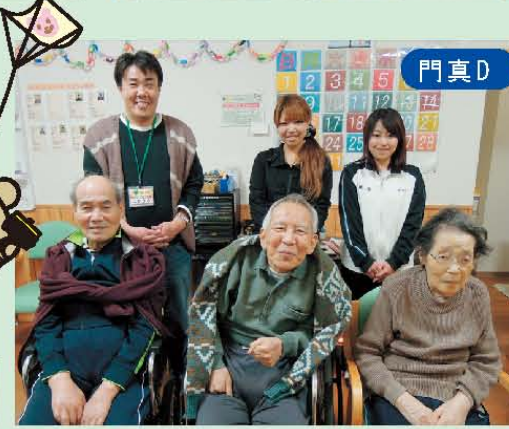
↑2012年の初写真♪いい笑顔ですよ!