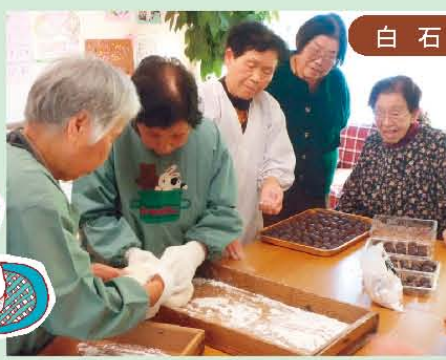
↑みんなで餅をコネコネ作りました!