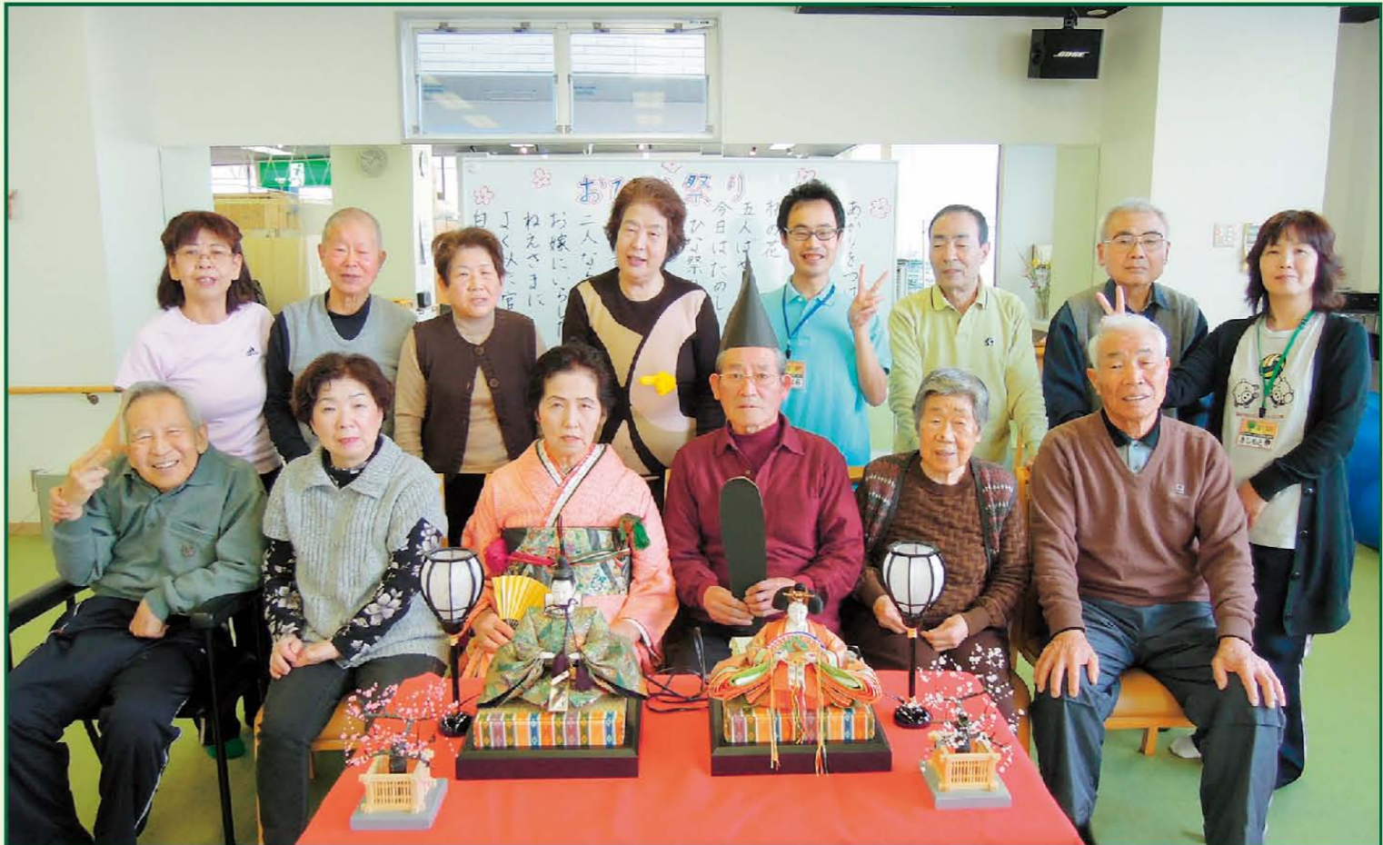
写真《ひな祭り》フィット&デイ樹楽 門真