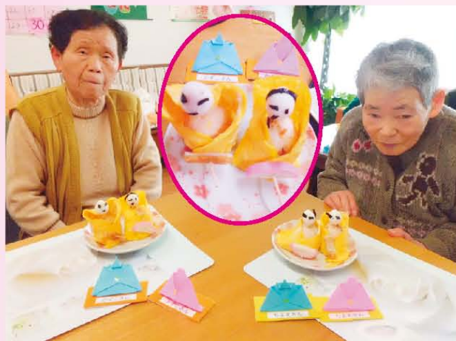
↑樹楽『団らんの家』白石 【食べるのがもったいない…かわいい雛人形の茶巾です】