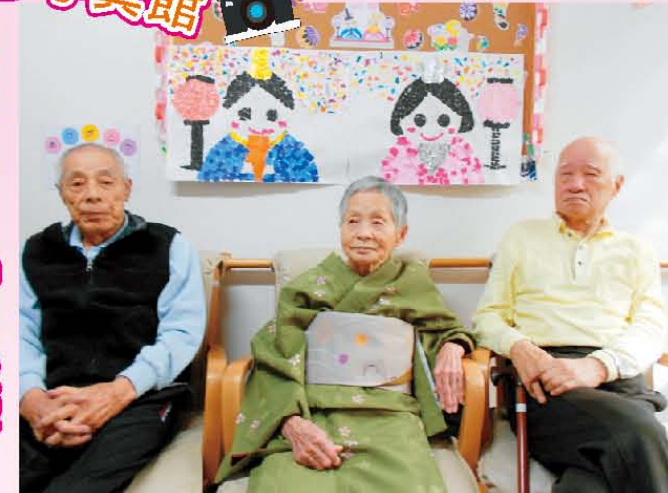
↑樹楽『団らんの家』ひの 【かわいいお雛様を真中に…お写真ハイチーズ!】