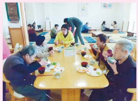
↑温泉とバイキングに行きました◎