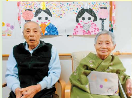
↑カメラを見てね!ハイチーズ☆