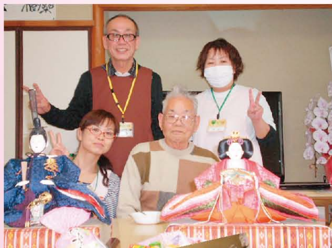
↑樹楽『団らんの家』香里園 【手作り雛人形の前で…パシャ♪】