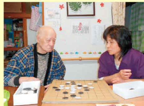
↑スタッフと真剣勝負! まだまだ負けんよ