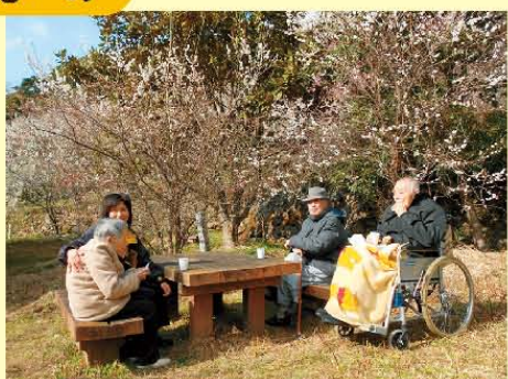
↑天気よかったのでお散歩に出かけ