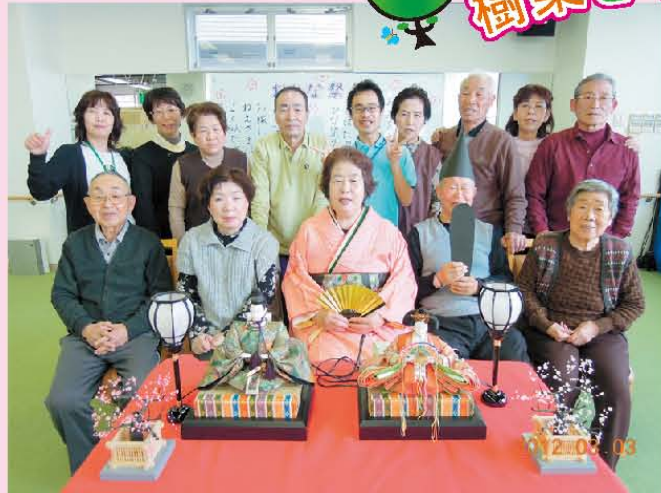
↑フィット&デイ門真 ※フィットネス 【着物をきて、本物のお雛様になりましたよ】