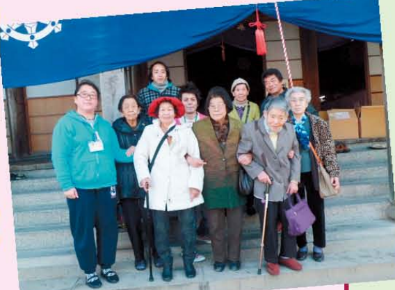
↑木原不動尊に行った様子です!