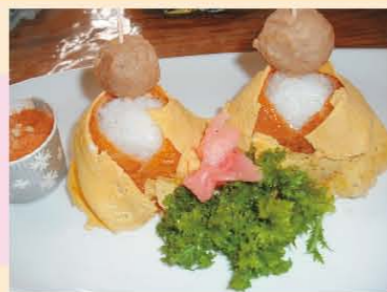
↑若久通りの、かわいいお雛おむすび(´o´)

まだ寒い日もあり、なかなか『春らしさ』を感じさせない日もありますが4月は年度があらたまり、新社会人や新学年が新たなスタートをします。また桜前線が日本を駆け上り生氣あふれる春の盛りとなります。8日は仏教の始祖・お釈迦様の生誕を祝う「花祭り」。下旬には大型連休(GW)が始まりますね。陽気の良い日は散歩が楽しみな季節ですね♪