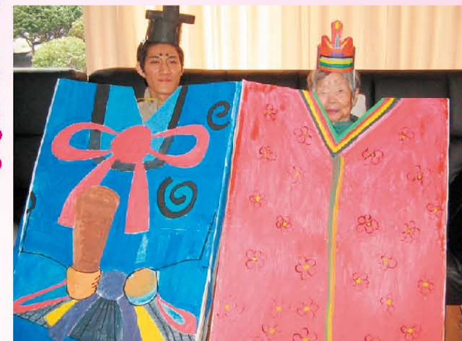
↑樹楽『団らんの家』門真東 【コココスプレ!? ……でもすごく可愛いね(^^)】