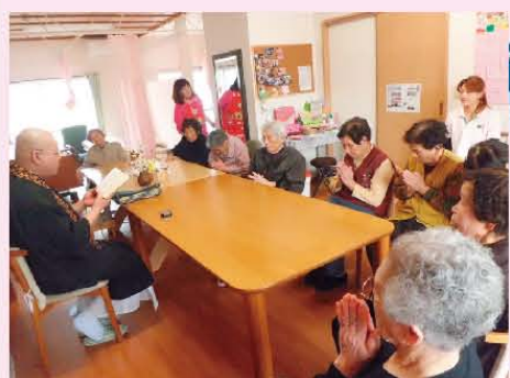
↑お坊さんに来ていただき、ご話していただきました!