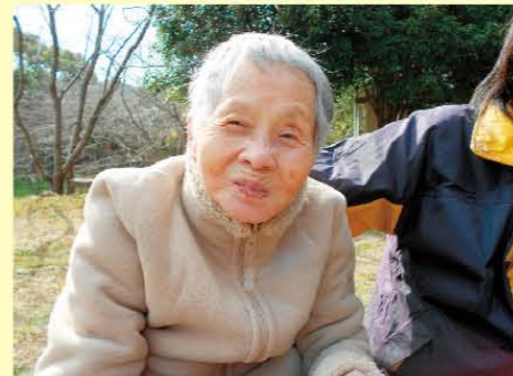
ました!おやつも食べたよ(^v^*