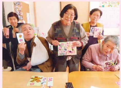
↑上手に出来たでしょ?押し花作り