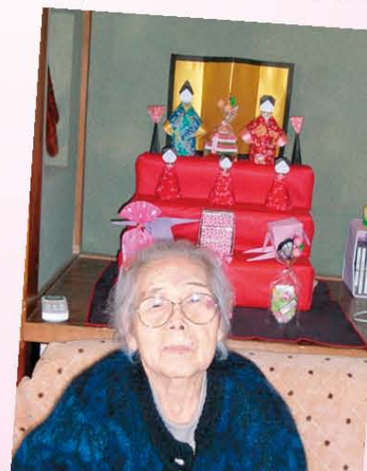
↑樹楽『団らんの家』香里園 【手作り雛人形の前で…パシャ♪】