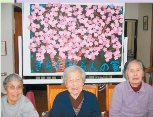
↑みんなで作った“桜”です