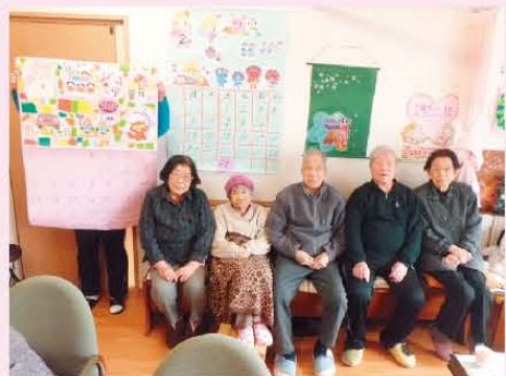
↑みんなでカレンダーを作りました!