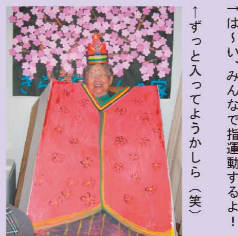
↑ずっと入ってようかしら(笑) →は〜い、みんなで指運動するよ!