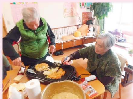
↑みんなでお好み焼きしましたよ!