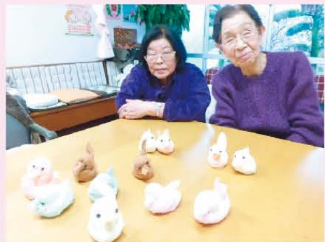
↑タオルアートでアヒル作り♪