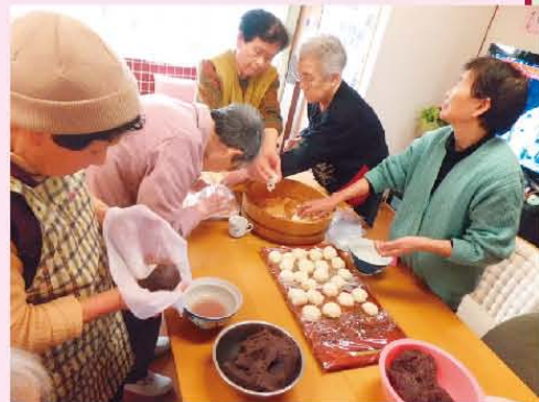
↑彼岸のおはぎ作りです!おいしそう