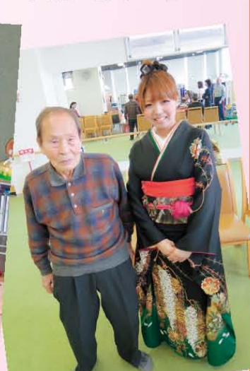
↑フィット&デイ門真 【若いお雛様にちよいテレ】