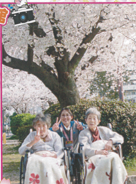
↑樹楽『団らんの家』高殿