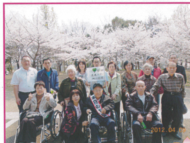
→樹楽『団らんの家』門真(フィットネス)