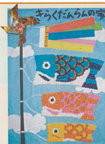
↑門真東の元気なこいのぼり

旧暦の5月は梅雨。「皐月晴れ」は梅雨の晴れ間のことでした。早苗を植える「早苗月（さなえづき）」の呼び名が略されたといわれます。八十八夜を過ぎ、立夏を迎え、暦の上で夏が訪れます。大型連休のGWに続いて、第2日曜日にお母様に感謝を捧げる「母の日」。運動会や、各地で初夏の祭りも行われます。新緑が生い茂り、年間で最もさわやかな季節ですね。