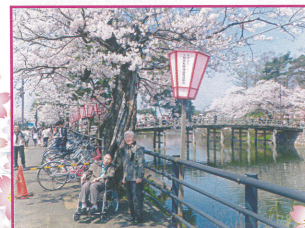
←樹楽『団らんの家』北城