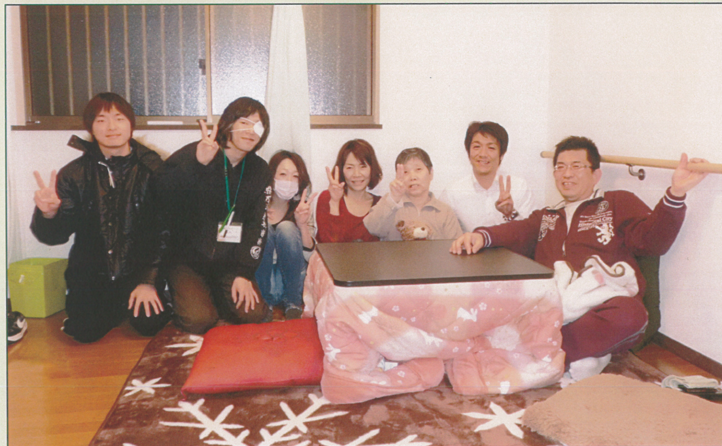
写真《みんなで団らん♪》樹楽「団らの家」高殿