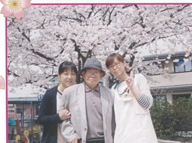
←樹楽『団らんの家』富吉