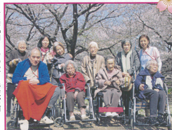
→樹楽『団らんの家』杉並宮前