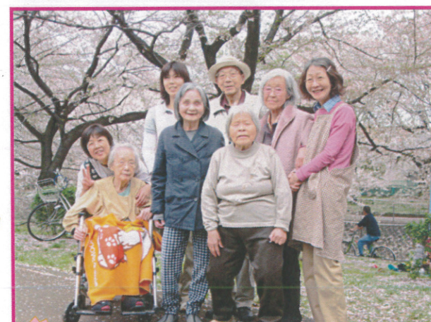
←樹楽『団らんの家』杉並宮前