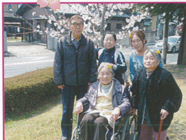
→樹楽『団らんの家』花池