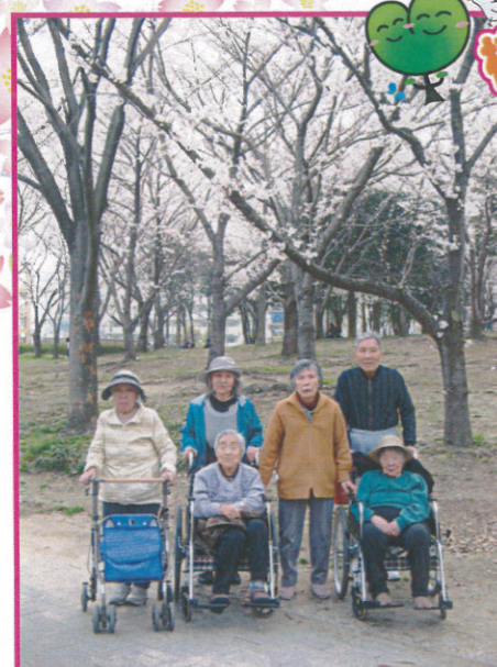
↑樹楽『団らんの家』門真東

今年も綺麗な桜が満開でしたね！ 樹楽のみなさんも “笑み満開”でした♪ また来年の桜が楽しみだね！