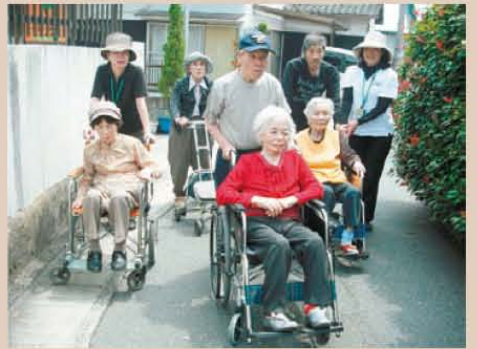
↑ 今日もお天気いいねえ~