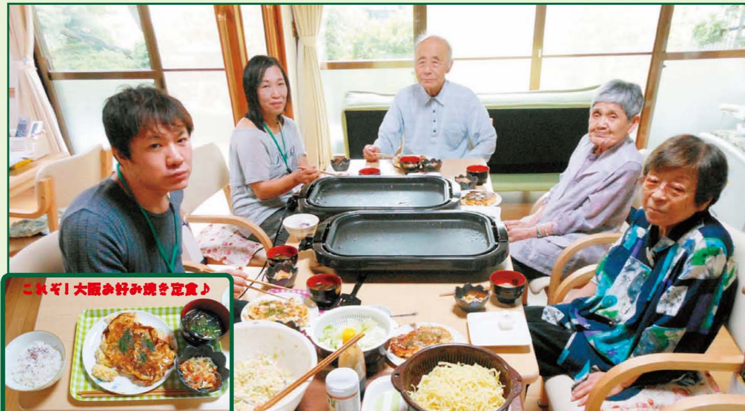
「お好み焼き」パーティ♪