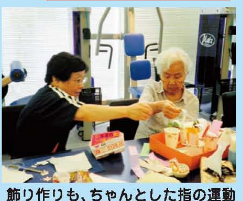
飾り作りも、ちゃんとした指の運動