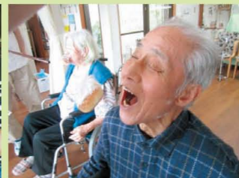
↑大きなお口をア～～～ン!! パン食い競争で楽しみました!