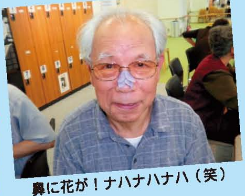
鼻に花が！ナハナハナハ(笑)