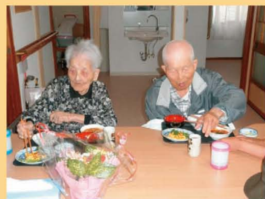
手作りの昼食！『おいしい』と大好評でした♪

6月に開所しました 「団らの家」日野東です 日野はのどかで、空気がお いしい！散歩がとても 楽しいですよ♪ 料理得意のスタッフが 作る昼食は、味に自信が あります！！ ぜひ、みなさんお気軽に 体験にお越しください！