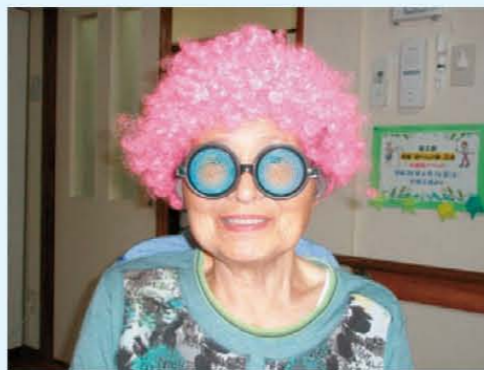
↑わたしは誰でしょう?!