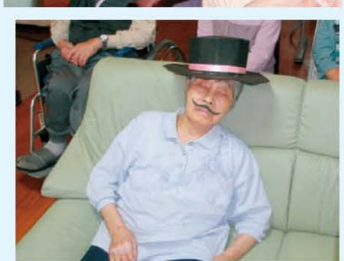
↑あらら…疲れて寝ちゃいました