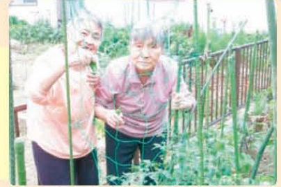
↑ 団らんの家 花池の直栽培ピーマン！夏に向けて栄養もしっかり摂ろう！！

新旧暦では稲穂が出る頃。「穂見(ほみ)」や「含み(ふみ)」に由来し、七夕の短冊に願いを書いたことから「文」の字をあてたといわれます。多くの地方で梅雨が明け、いよいよ夏本番になりますね。七夕や各地域ごとに、昔ながらのお祭や行事がいっぱい行われますね。楽しい季節ですが、お出かけ時には帽子を着用し、しっかりと水分補給をしましょう！