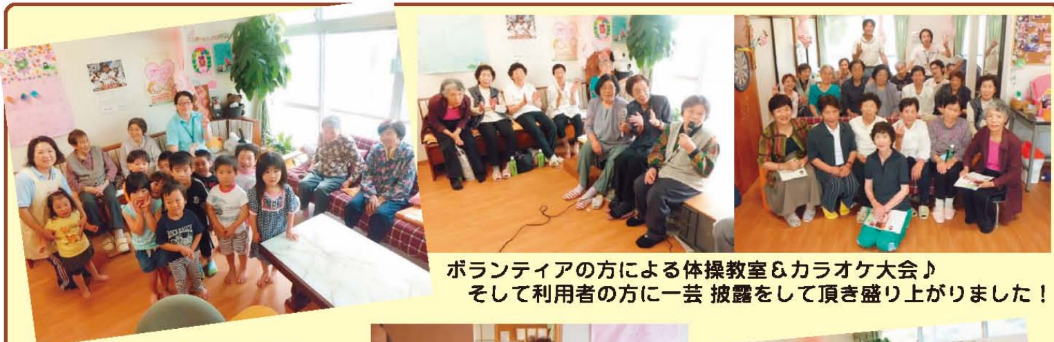
ボランティアの方による体操教室&カラオケ大会♪ そして利用者の方に一芸披露をして頂き盛り上がりました！