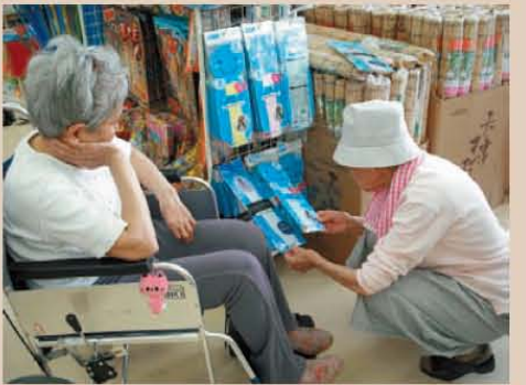
↑ 100円ショップにて・お散歩