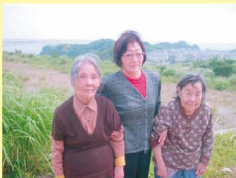
↑葉山国際村へお出かけしました!