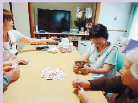
ジジぬき、誰が1番になったかな?