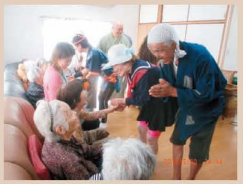
↑ 「としとら~ずさん」のイベント！すごく楽しかった！大爆笑♪