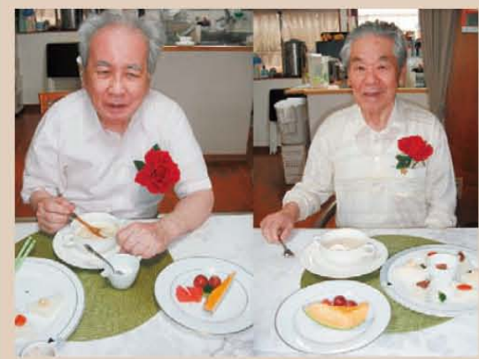
↑ 「父の日」の朝感謝の気持ちを込めたスペシャルメニューです！