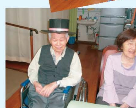
↑帽子お似合いですよ☆