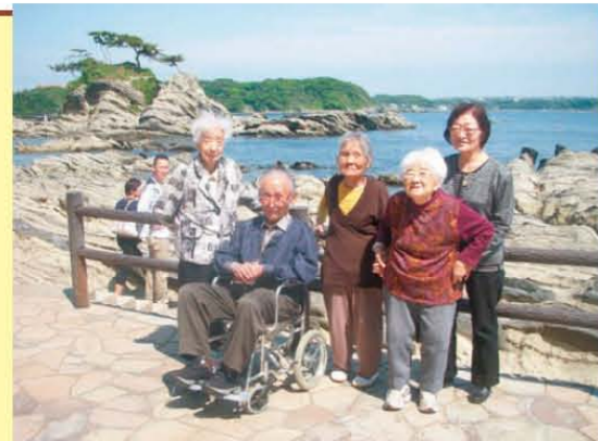
↑荒崎公園へ遠足に行きました!