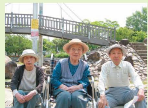
↑公園へお散歩に行きました♪