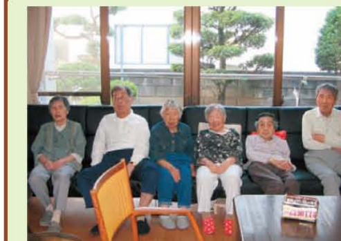
↑気持ちいい縁側で写真撮影☆