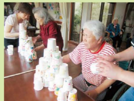
↑どこにおこうかな～？