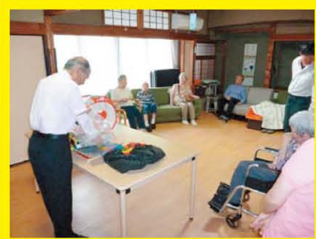
香里園では七夕マジックショーで楽しませていただきました♪