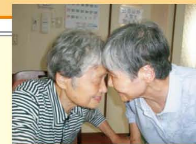
↑がちんこ勝負!! ゴツン!