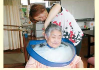
↑美容師さんに可愛くしてもらいました!