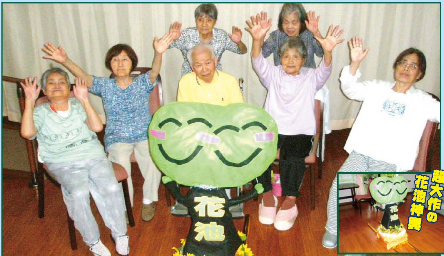
写真「夏だ!! みこしだ!! 花池だ!! ワッショイ♪ワッショイ!! さあかつくぞ!!」樹楽『団らんの家』花池