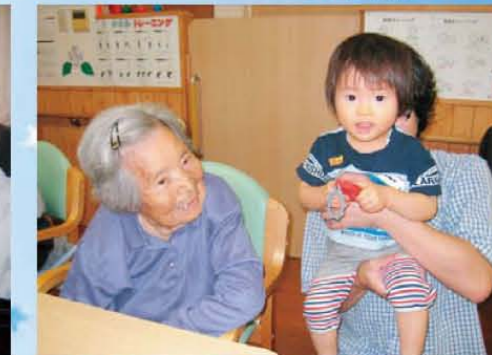
↑93歳と1歳の2ショット♥