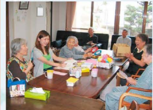
↑みんなでじゃんけんゲーム