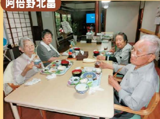
↑みんなといっしょにいただきます♪