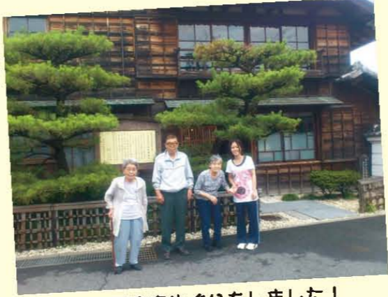
↑世界遺産めぐりをしました!