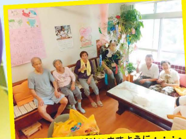
皆さんの願いが叶いますように・・・