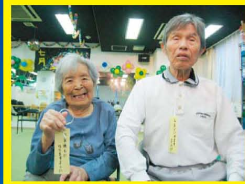
門真では演奏会やダンスで七夕をみんなで楽しく過ごしました♪