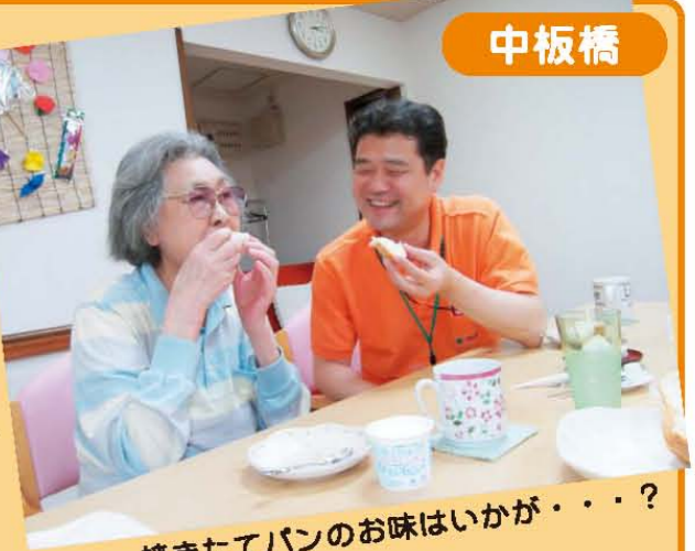
焼きたてパンのお味はいかが・・・?