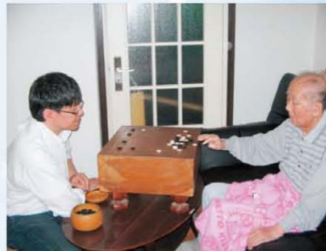
↑囲碁の真剣勝負だ!!