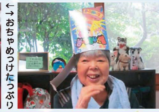
←おちやめつけたっぷり