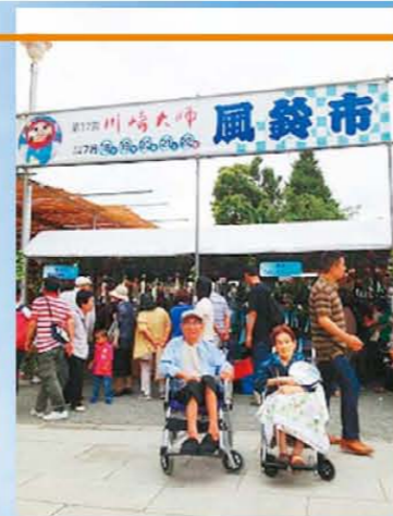
←風鈴市にお散歩行きました