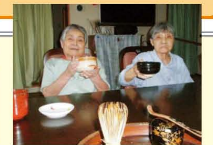
↑もう一杯お代わりください!