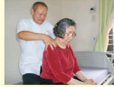
↑すごく疲れがとれるのよお～