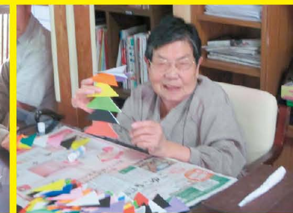
私市は、天の川「天野が原」という地名があらわすところり七夕祭りがとても盛況なのです