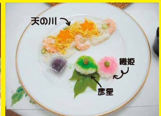
★若久通り「天の川ランチ」★