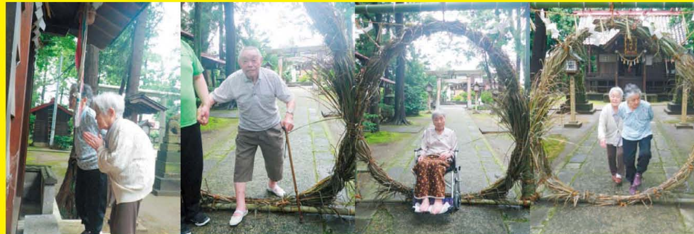
施設から歩いて5分ほどのお宮さん(北城神明宮)で「茅(ち)の輪くぐり」という神事がありました。この輪をくぐり越えて罪やけがれを取り除き、心身が清らかなるようにお祈りするものです。当施設のご利用者様も数名その神事の茅の輪くぐりをされ大変喜んで帰ってこられました。「ほけが治るようになってお参りしてきたわ」「足が痛いのが治るように」「みんなが幸せになるように」と、様々な願いをしてきたと職員に話を聞かせていただき大笑いをされていました。