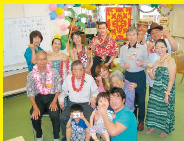
★フィット&デイ門真★