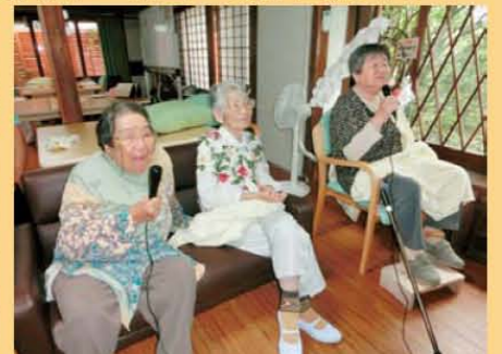
↑マイクを握ったら離しませんよ!