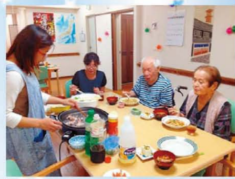
↑ホットプレートでお昼ご飯