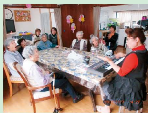
↑口を大きくあけて皆健康