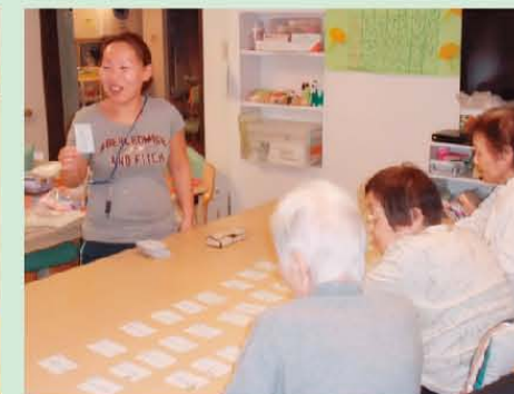
↑かるたゲーム。皆さん真剣です…