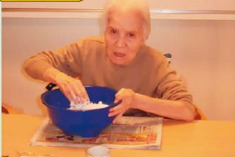
↑おやつ白玉作りを手伝って下さってます。