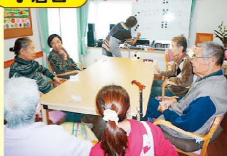
↑レクもにぎやかになってきました