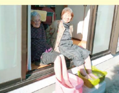
↑日当たりの良い縁側で、仲良く足湯です