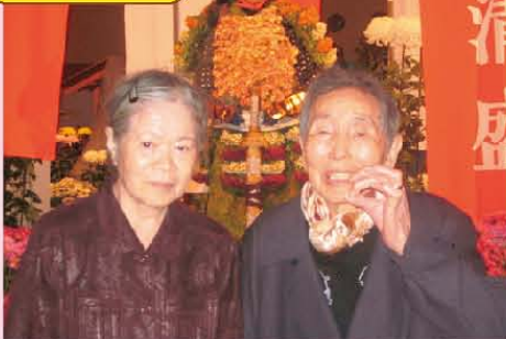
↑みんなで、ひらかた菊人形祭を見に行きました!今回のテーマは「平清盛と源頼朝」でした。