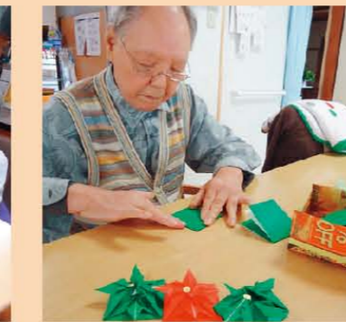
↑クリスマスリース製作中!