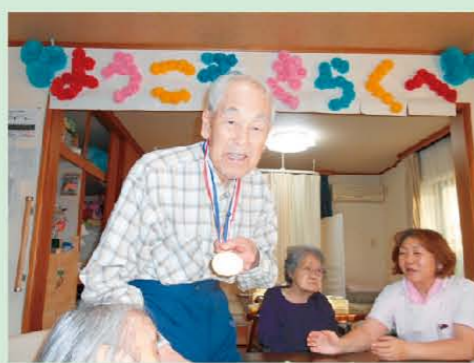
↑胸に輝くメダルです＼(^▽^)/