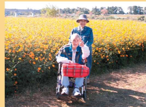
お花畑へお散歩に行きました！