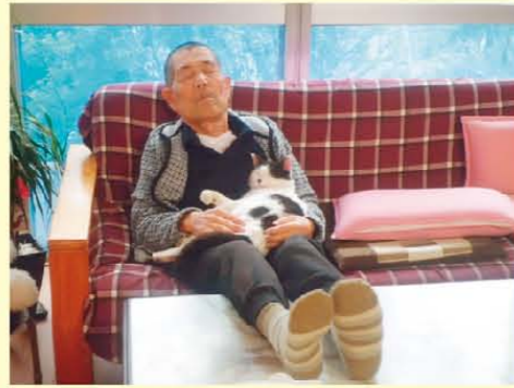
↑猫と一緒にお昼寝中。(。__。 ) zzz