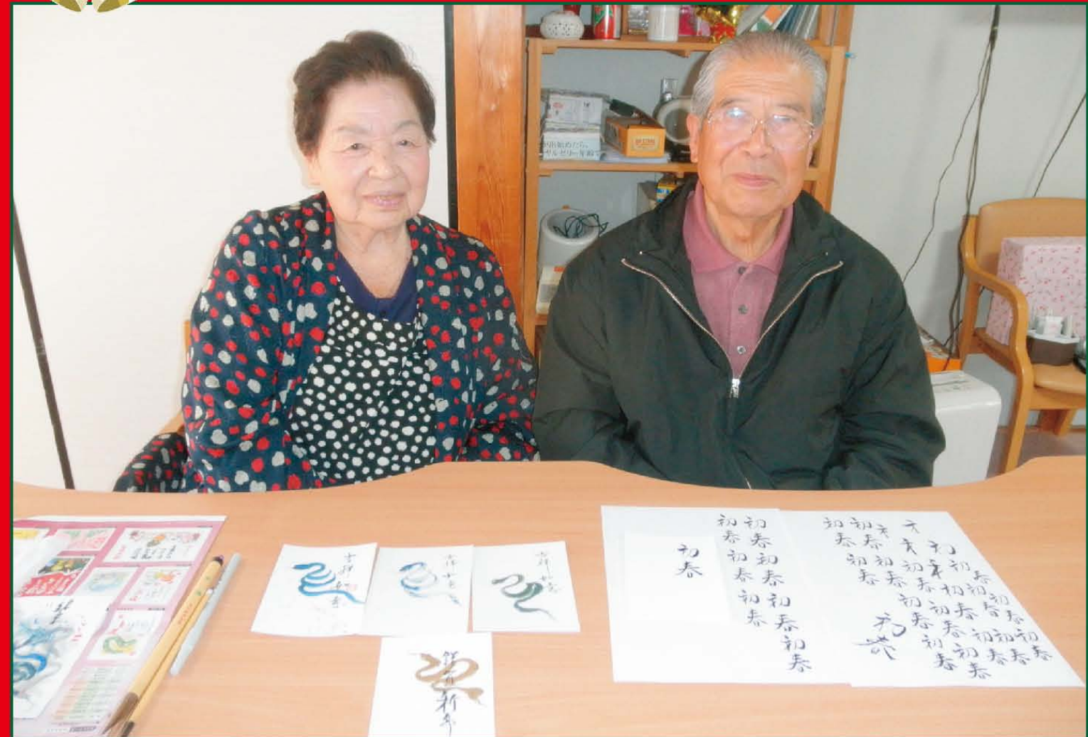
写真《芸術の秋。樹楽「団らんの家」日野東では、皆様の作品を展示しております。》