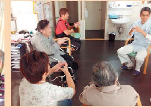
↑先生の指導で指運動