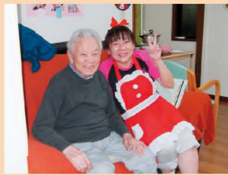
↑うん、きみ可愛いね。。