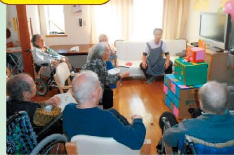
↑秋の大運動会を開催しました♪