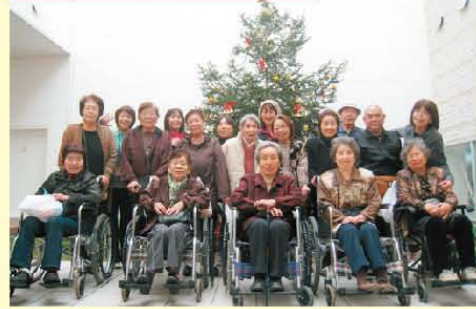
↑100均へ遠足♪ツリーがあったので記念撮影☆