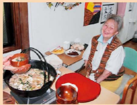
↑わーっ、美味しそう!