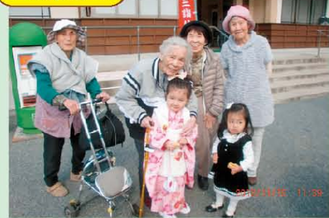
↑七・五・三いつの事だったか