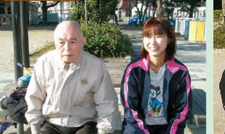
↑秋晴れにて近くの公園にお散歩に出かけました。皆さん全身で秋を感じていました。