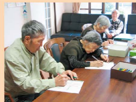
↑みなさん塗り絵に熱中です