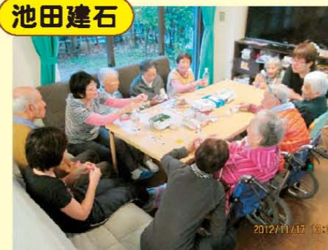
↑音楽会にむけての楽器作り☆