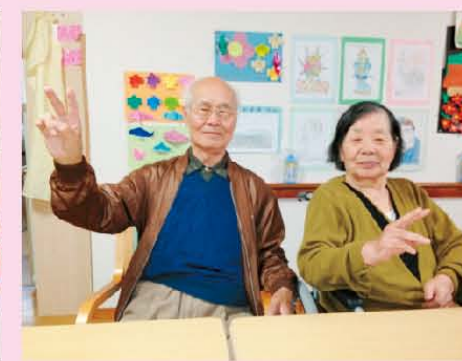
↑夫婦いっしょにピースv(°▽°)v