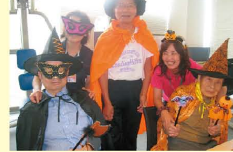
↑ハロウィン♪ みなさん意外と進んで衣装してくれました( ^ ^ )