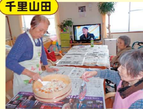
↑皆様でちらし寿司を作りました!