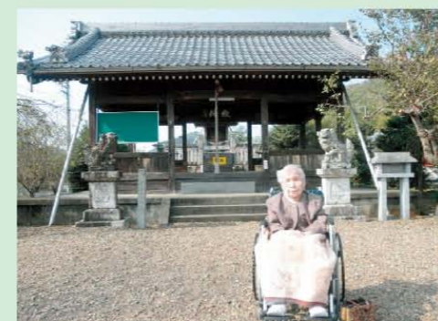
↑近くの神社までお散歩です。山の紅葉が綺麗でしたね。