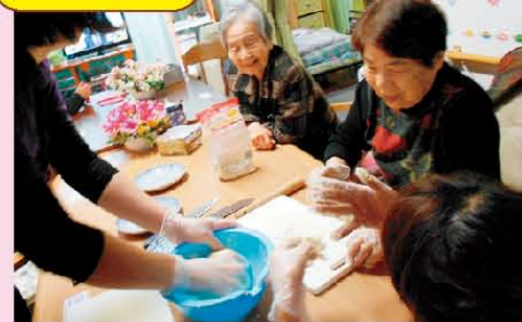
↑特別支援学校の高校生が職場実習に9日間来た際に利用者様とおやつ作りレクリエーションです。