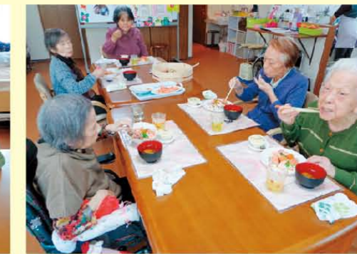
↑それでは皆さん「いただきま〜す!」