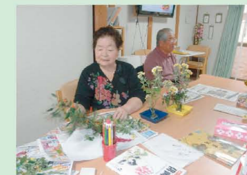
↑講師による華道教室を開催。綺麗にお花を生けました。