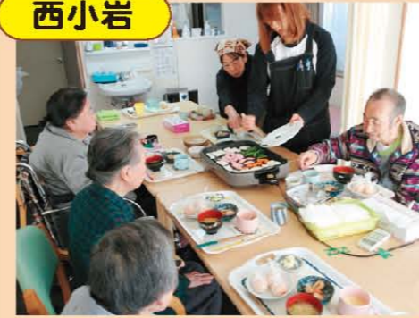
↑ホットプレートで昼食会しました! みなさん、いっぱい食べましたね