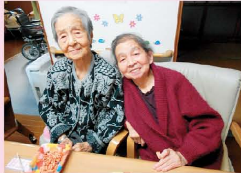
↑ひのの利用者様は、お母さんのような優しい方がたくさんいらっしゃいます。