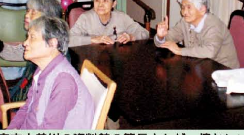
↑一宮市木曾川の資料館の管長さんが、懐かしい蓄音器をもって頂き、皆さんのとって懐かしい音楽を流して頂けました。