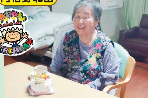
↑お誕生日おめでとうございます☆