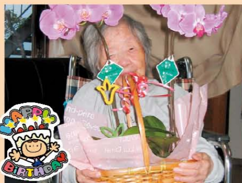
↑100歳のお誕生日の記念写真☆