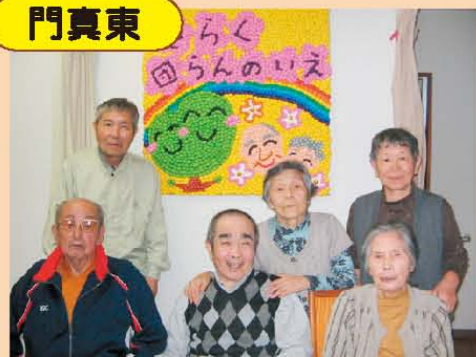
↑みんなで手作りした樹楽看板です♪