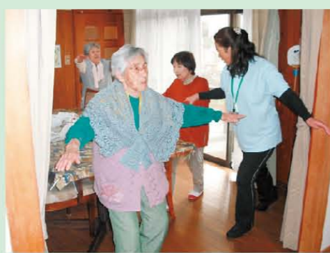
↑長生きは朝のトレーニングから