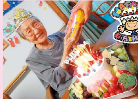
↑私の誕生日をして頂きありがとうございますと丁寧な挨拶を頂きました。