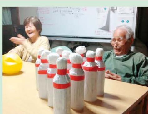
↑ボーリングゲーム楽しいな♪