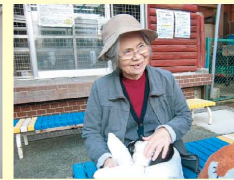
↑動物園にて「このコ連れて帰りたい!」