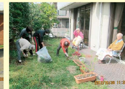
↑冬が来る前にお庭をきれいに♪