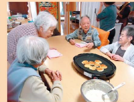
↑ホットケーキ、もう焼けた?