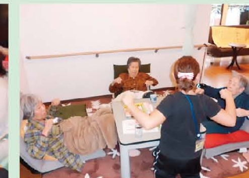
↑頑張って体操、いっち、にー!