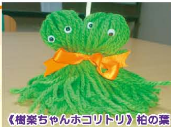
《樹楽ちゃんホコリトリ》柏の葉