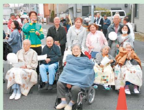
↑パレードを見に行きました！