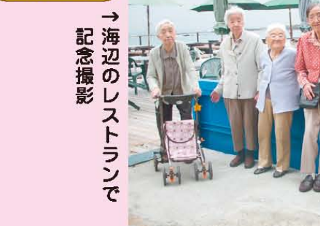
→海辺のレストランで記念撮影