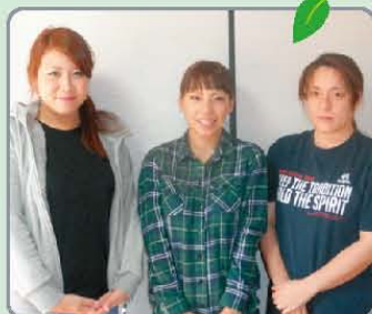
樹楽「団らんの家」日野東 スタッフのみなさん

寒さも一段と増し、コタツが恋しくなる季節になりましたね。早いもので、今年も残りわずかとなりました。私達、日野東のデイサービスは今年の6月に開所しましたが、本当にあっという間の半年でした。ご近所の皆様、ケアマネージャー様、そしてなによりご家族様・ご利用者様の支えもあり、無事に年末を迎える事が出来ることに感謝です。ありがとうございます。さて、私達、日野東のデイサービスでは、日々、ご利用者様が満足して利用して頂けるよう日中活動やお食事等、お一人お一人のご要望に出来る限りお応えできるよう心がけております。特にお食事に関しては、生活の中の楽しみでもある為、より一層力を入れております。バランスの良い健康的なお食事を、おいしく食べて頂けるよう一つ一つ考え心を込めて手作りしております。お陰様で、ご利用者様には好評を頂いております。今後も「おいしい!」と、一言が聞けるよう努力していきます。来年もどうぞよろしくお願いたします。