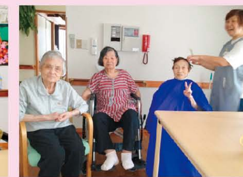
↑美容のサービスもあります