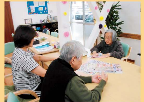
暖かい陽射しが入る部屋でゆったり