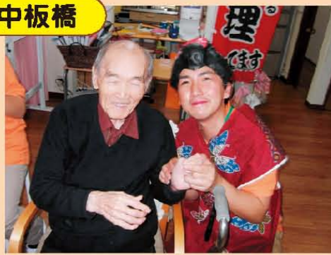
↑熱海に行きたいな!?