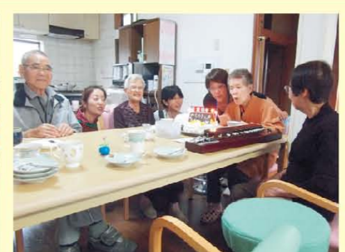
↑施設で初めてのハッピーバースデーです