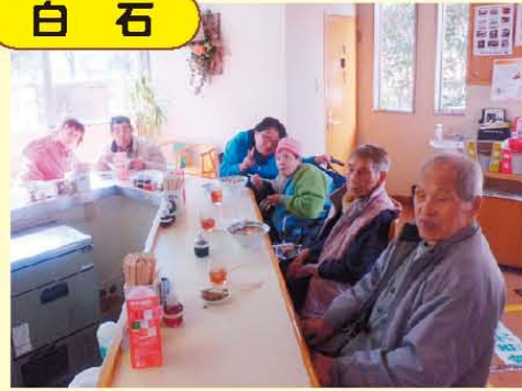
↑金峰山へとドライブの帰りにラーメン屋へ!