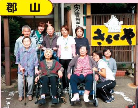
↑貸切温泉旅行で記念撮影