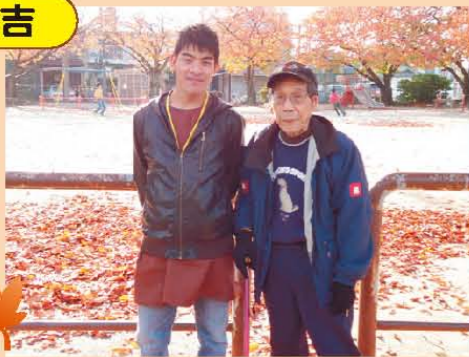
↑近くの公園の桜が見事に紅葉していました♪