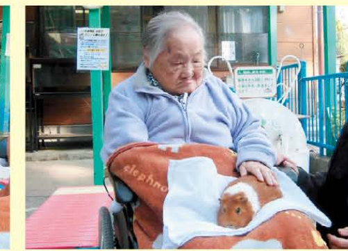
↑オソルオソル・・・(^_^;)