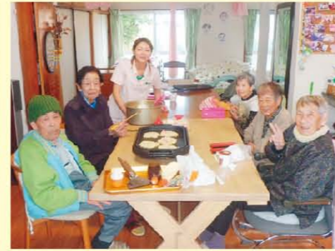
↑昼食用のお好み焼き作り(●`ω`●)