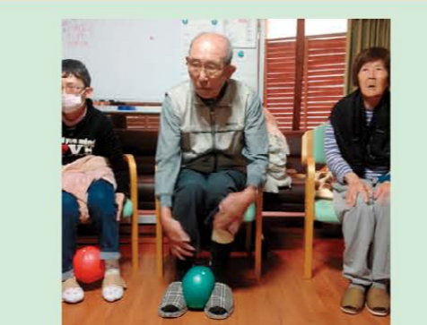
↑ボールを使つての運動です