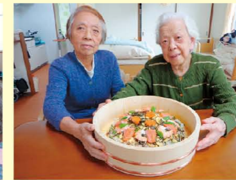
↑どう?すごく美味しそうでしょ!