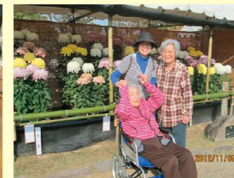
↑菊花展を観に行きました。