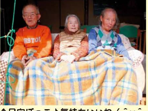
↑日向ぼっこ♪気持ちいいね (^v^)