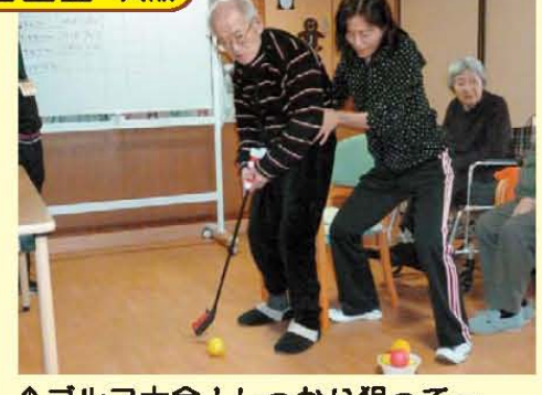
↑ゴルフ大会! しっかり狙って〜