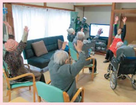
↑1・2・3! 体を動かして温めます