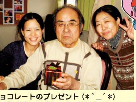
バレンタインデーは花池より心を込めたチョコレートのプレゼント(*^_^*) 女性の方々は手作りチョコレートケーキを作りました(^_-)-☆凄いでしょ! みなさんHAPPYになれました。

節分祭を開催致しました! 皆々様が一年間健康で笑顔で 過ごされるように鬼を追い出 し、副を呼び込みました!