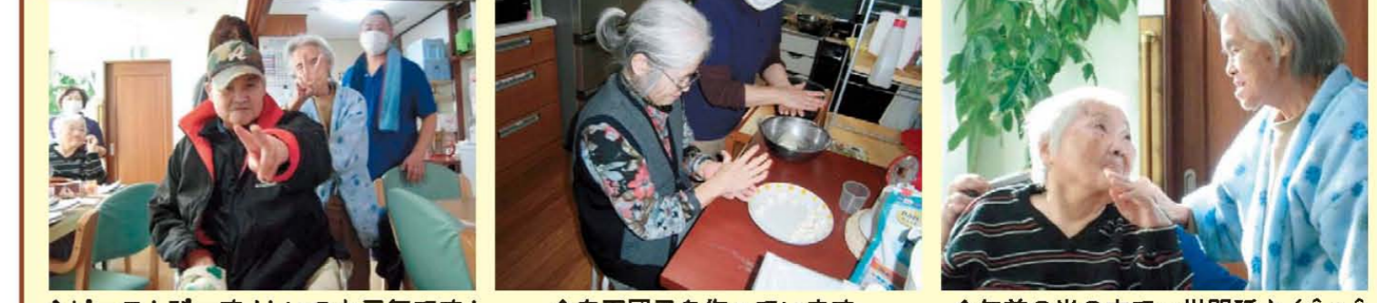
↑ ピース! びーす!! いつも元気です! ↑ 白玉団子を作っています ↑ 午前中の光の中で…世間話♪ (^o^)