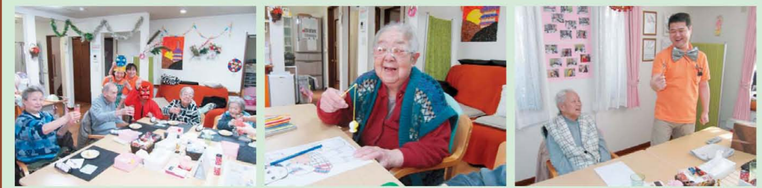
↑ 鬼退治! 大成功!! ↑ 釣れたよ! でもぬり絵が大好き ↑ ザ・マジックショー!

これからも利用者様、ご家族の皆様喜んで頂けるサービスを目指してスタッフ一同、一歩一歩前進していきます。