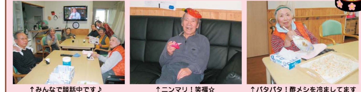
↑ みんなで談話中です♪ ↑ ニンマリ! 笑福☆ ↑ バタバタ! 酢メシを冷ましてます

樹楽「団らんの家」中板橋へ 皆様お気軽に施設見学・お問合せをどうぞ! 〒173-0022 東京都板橋区仲町 39-15 TEL.03-5926-7185 FAX.03-5926-7186