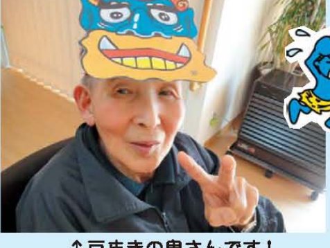
↑豆まきの鬼さんです!