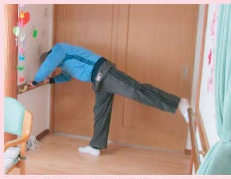
↑バランス取ってみました…