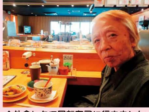
↑外食レクで回転寿司に行きました。