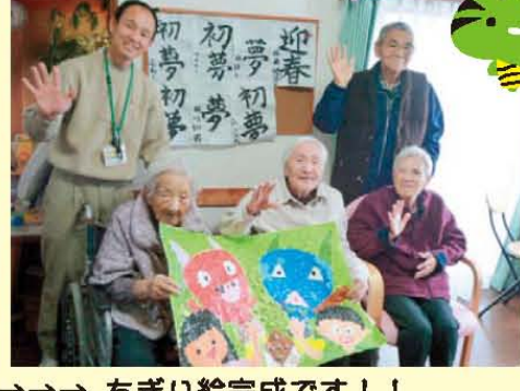
↑皆さん働きます。協力して、布団カバーを交換中!!