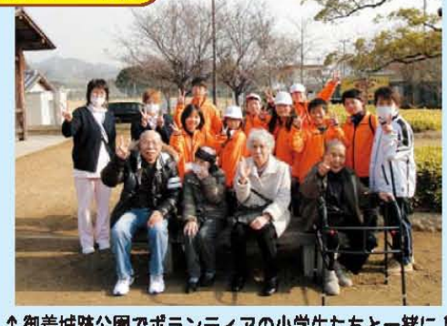
↑御着城跡公園でボランティアの小学生たちと一緒に!