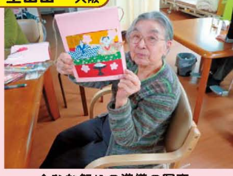
↑ひな祭りの準備の写真