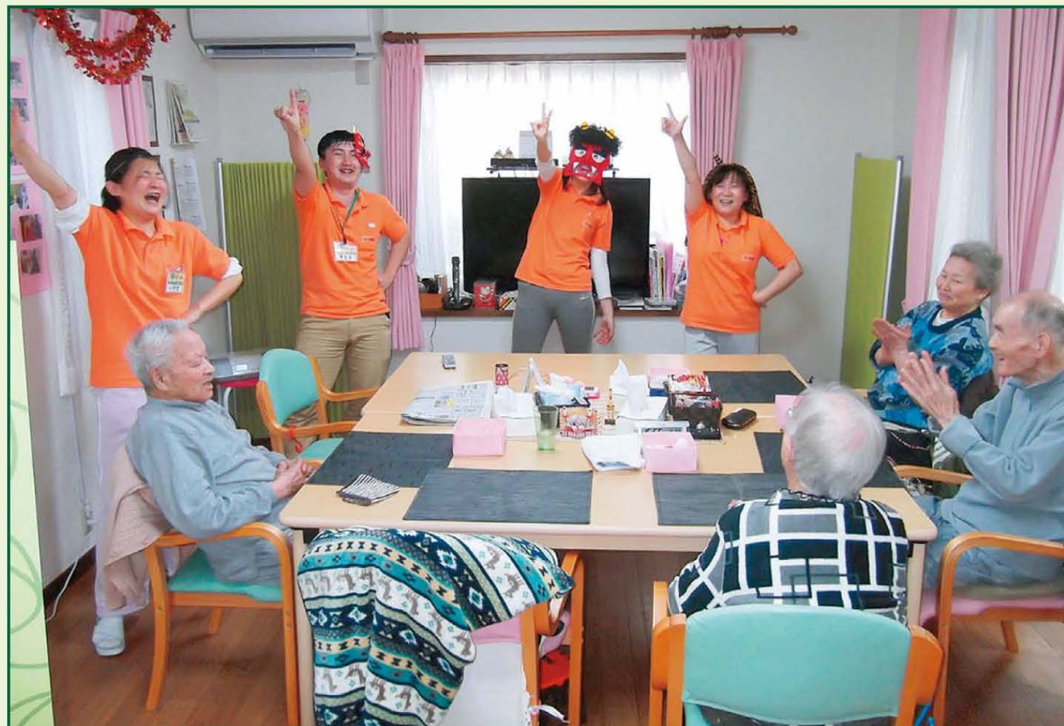
写真《みんなでダンス♪ダンス♪、(´▽`)人(*´▽`)人(´▽`)人(*´▽`)人》樹楽『団らんの家』中板橋