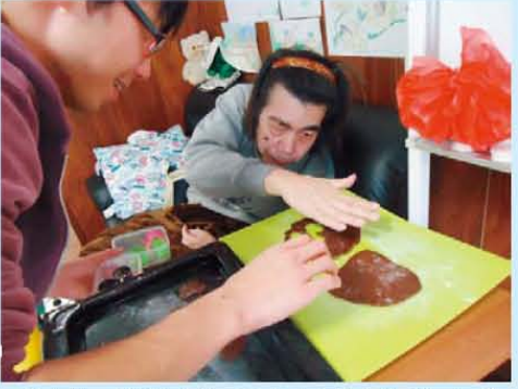
↑パン作り! いろんな型で切抜き中