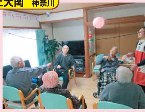
↑「それ! アタック!!」白熱してます!!