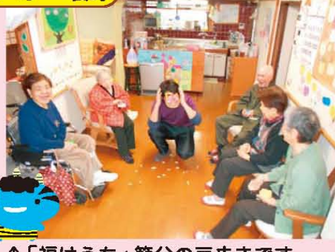
↑「福はうち」節分の豆まきです。