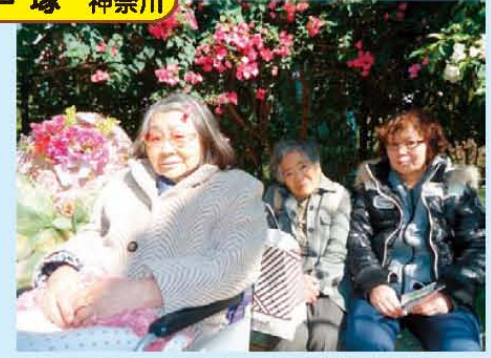
↑フラワーセンターに行きました♪