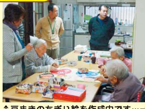
↑豆まきのちぎり絵を作成中です…→→→ ちぎり絵完成です!!