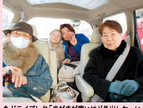
↑ドライブレク「まだまだ寒いけど外出した〜い」