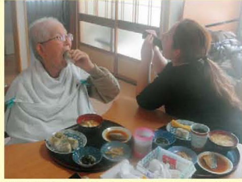
↑恵方巻き。食べきる前に…つい喋ってしまいました…