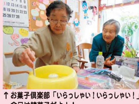
↑お菓子倶楽部「いらっしゅい! いらっしゅい!」 今日は綿菓子だよ!!