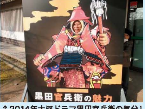
↑2014年大河ドラマ黒田官兵衛の気分!