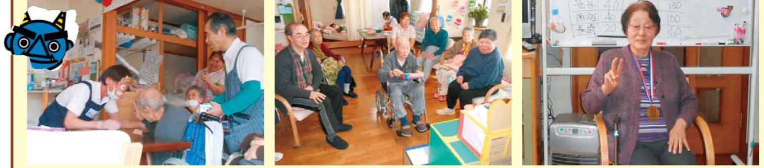
↑ 節分の豆まきで鬼は外~~~~!! ↑ レク(頂上争戦)しました! みなさん超真剣です!!