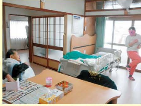
↑節分会。鬼退治に真剣です!