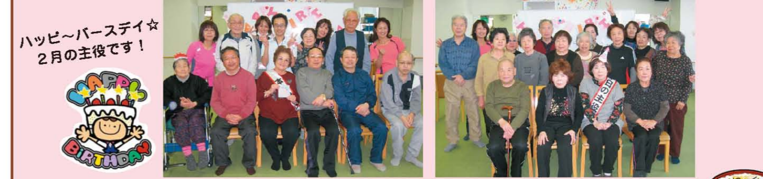
ハッピーバースデー☆ 2月の主役です!