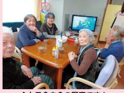
↑女子会中?の写真です♪