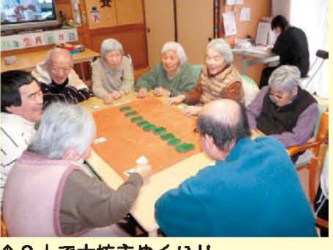
↑9人で大坊主めくり!!