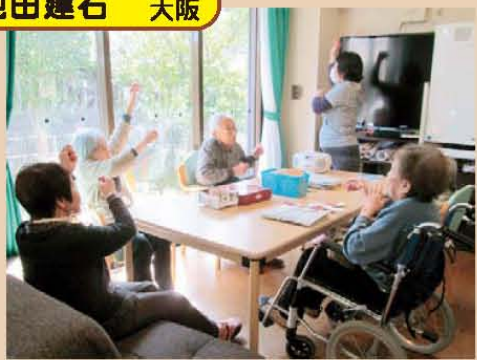
↑1.2.1.2...元気にラジオ体操(^o^)/