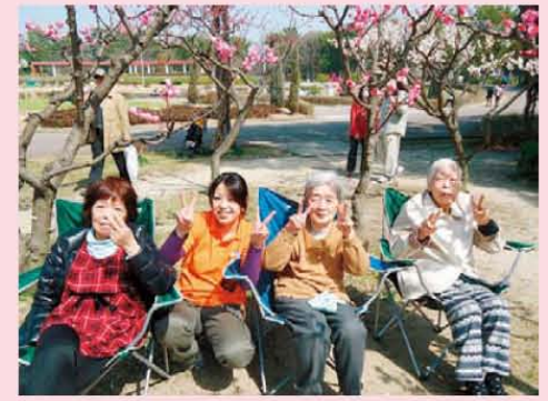
↑天気の良い日にお散歩♪梅がきれいでした。