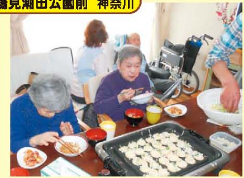
↑3月のイベントで、みんなでたこ焼きパーティーにゴルフ大会をしました♪