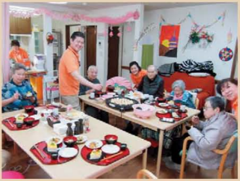
↑笑顔もお腹もいっぱい∞(無限大)