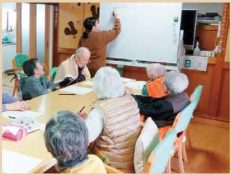
↑大先生がお越しになられて書道教室