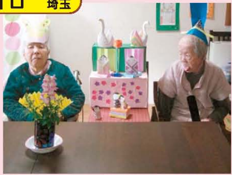
↑ひな祭りの写真…カメラを見てね