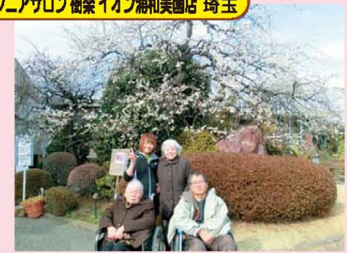
↑一足早い梅の花見学