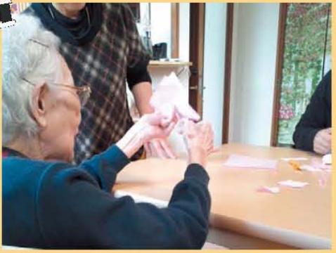
↑桜の花びら製作中!