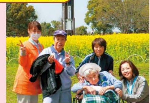
↑満開の菜の花を見に行きました♪