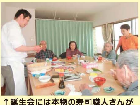
↑誕生会には本物の寿司職人さんがボランティアで来てくれました