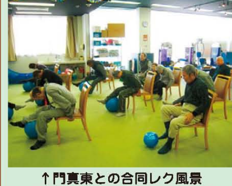
↑門真東との合同レク風景 いっぱい体を動かしましたね!