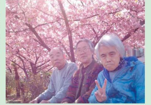
↑早咲きの桜が満開です!!