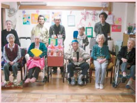
↑楽しいひな祭りだったね