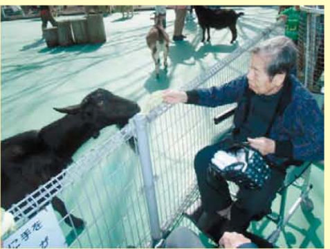
↑お散歩で動物園に。「キャベツお食べ」