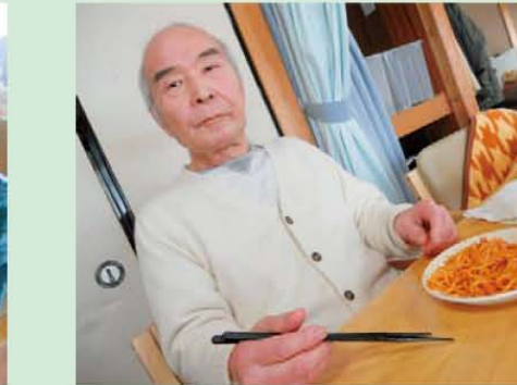
↑小南さん今日もおいしいご機嫌さん