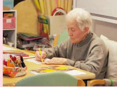
↑気軽に取り組み、気軽に笑い、気軽に語り合い、思い思いのひとときを過ごす。それが、樹楽高殿の一日です。