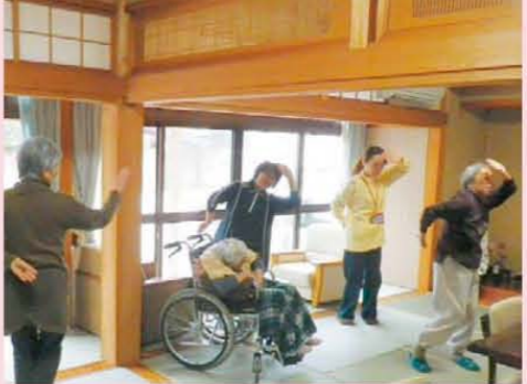
↑元芸者さん!?みんなで踊りのお稽古