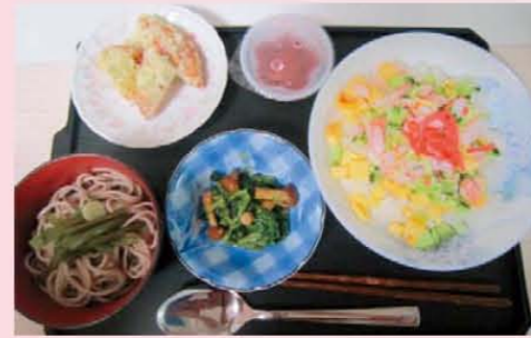
↑ひな祭りお食事：彩りちらし寿し 青菜となめこの和え物・天ぷら 山菜わんこ蕎麦・桃ゼリー