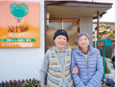
↑今日は暖かいので皆でお散歩。