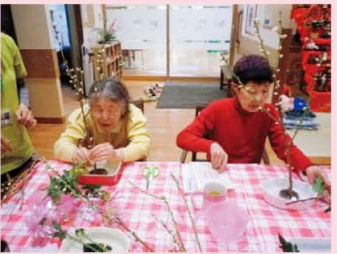
↑初めての華道教室