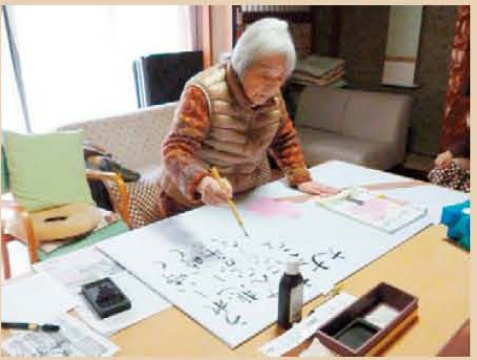
↑大作品を制作中です