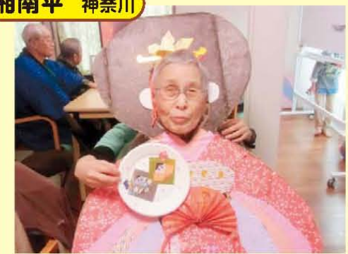
↑ひな祭りでおひな様に変身!