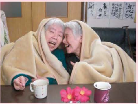
↑うふふ…毛布にくるまりモゴモゴ