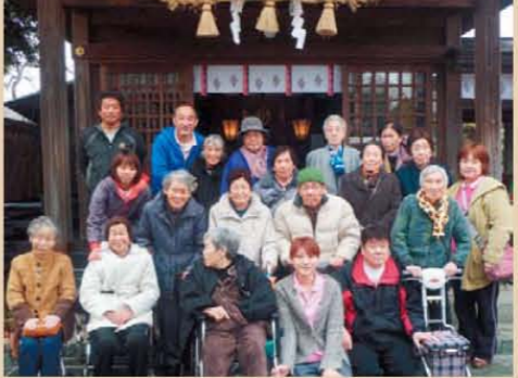
↑よそ見しないで☆(^▽^*)集合☆