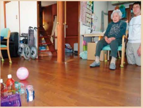
↑ボーリング大会!スベアとれるかな?!