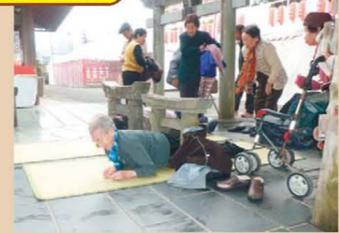
↑粟嶋神社にて、こんな小さな鳥居もくぐります!!