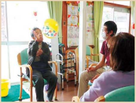
↑トクさん、ナイスアタック!!