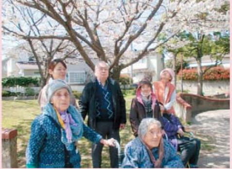
↑ひと足早いお花見です