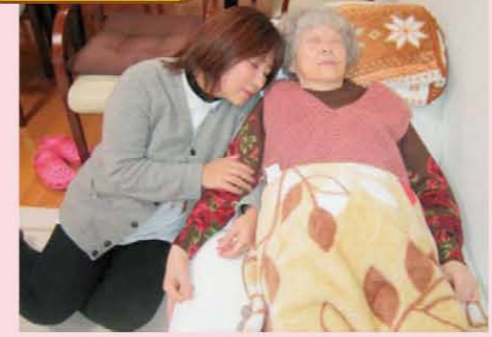
↑ただ今、お昼ね中です Zzz Zzz…