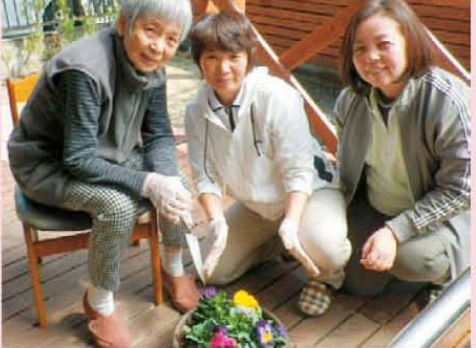
↑色々な花をガーデニング