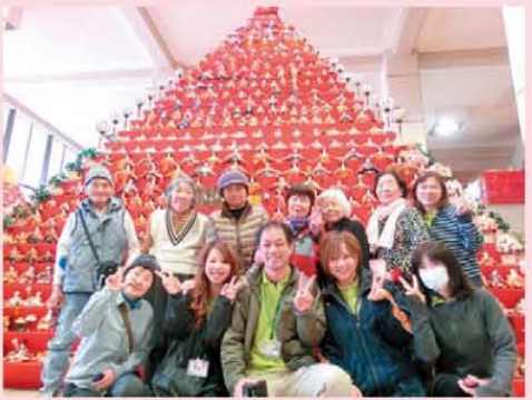
↑日本一の雑壇を見に行きました!!!