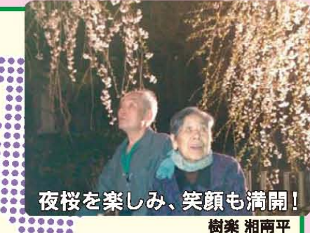
夜桜を楽しみ、笑顔も満開! 樹楽 湘南平