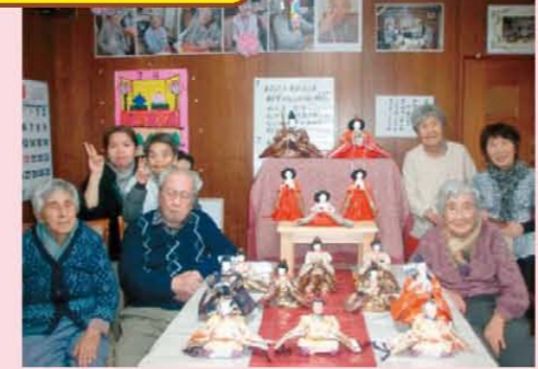
↑ひな祭りの記念撮影☆