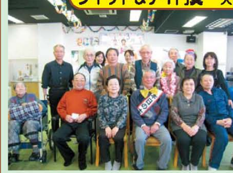
↑3月のお誕生日会です!