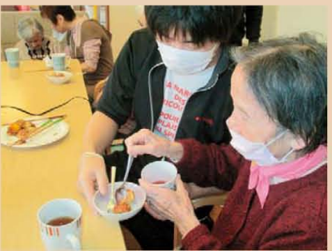
↑初めてのたこ焼き風ホットケーキ作り☆