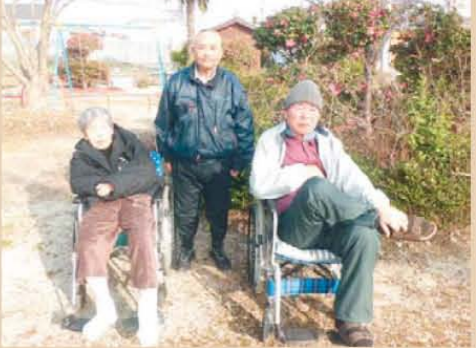
↑三人でお散歩。。ポーズ決まっています!