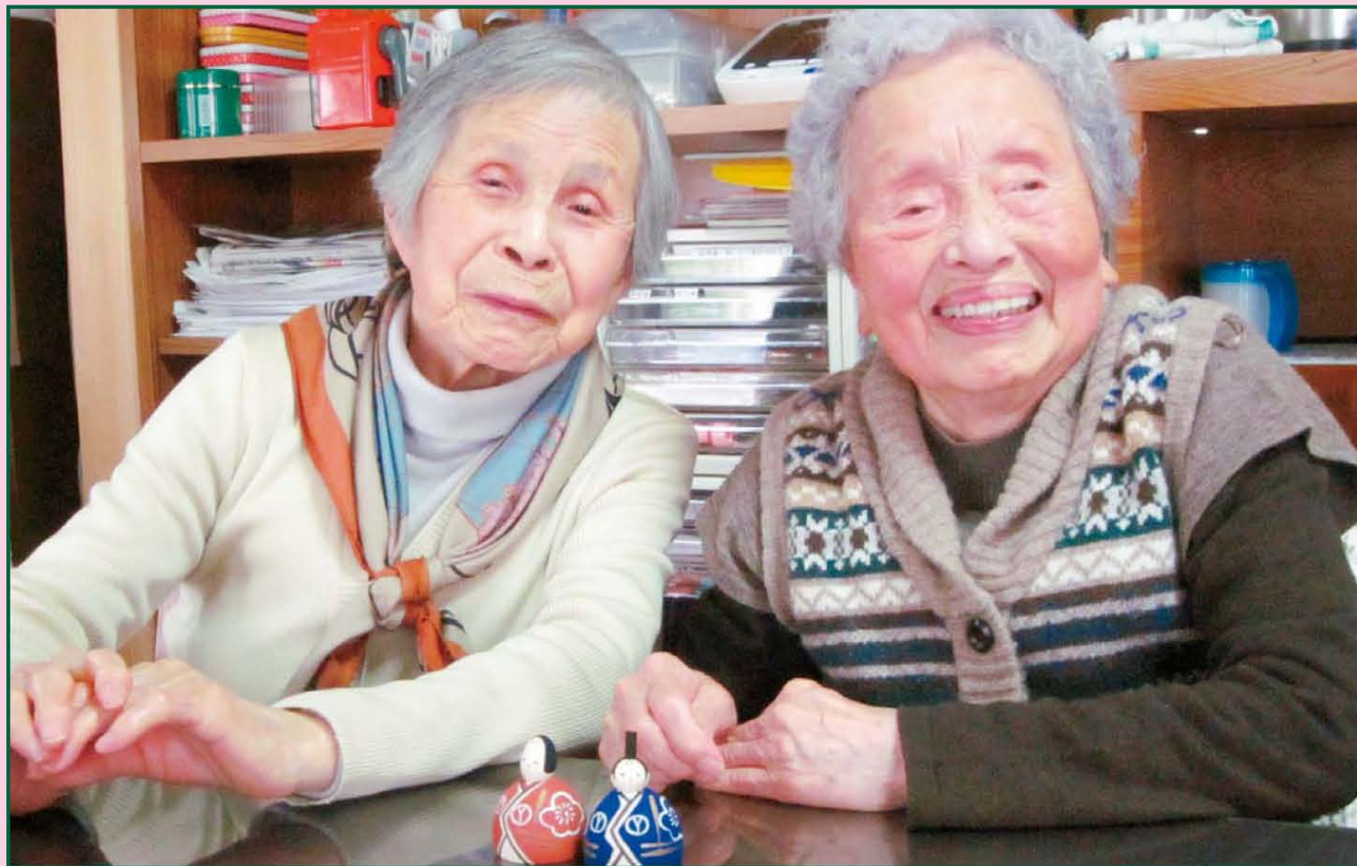
写真〈ありがとう〉樹楽「団らんの家」私市