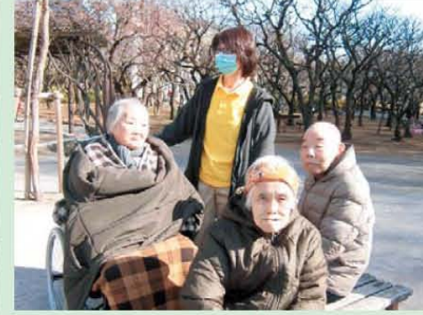
↑梅は早かった・・・