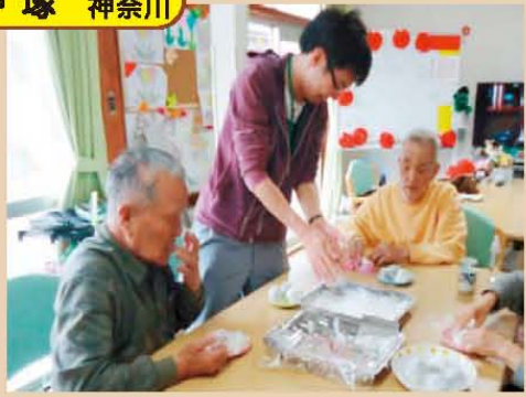
↑みんなでいちご大福作り☆