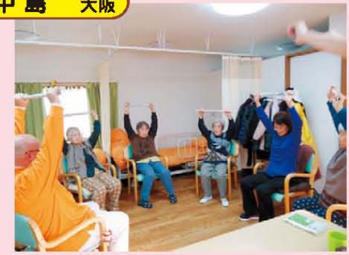
↑1・2・3! 中島では毎日しっかり機能訓練しております!!