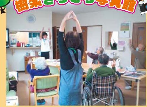
↑さあ! みんなで体操!!