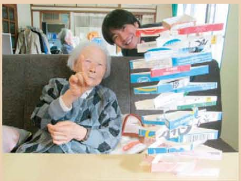
↑白い拒塔で新記録達成!!