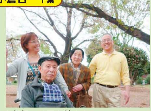
↑新緑の公園を散歩♪