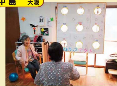
↑室内レクの様子です