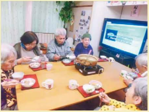
↑今夜は鍋です! なかなか美味です!