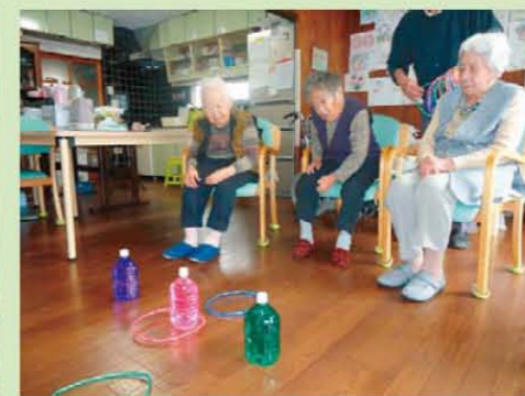
↑輪投げ大会!! ( ^ ▽ ^ )ノ≡〇