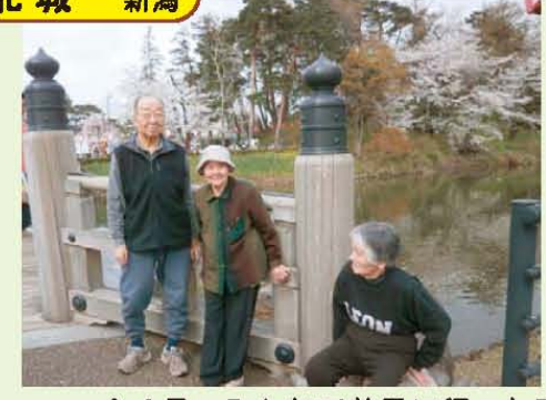
↑4月: みんなで花見に行った時の様子です。天気が良くてよかったね♪ \ (≧▽≦) / \ (≧▽≦) /