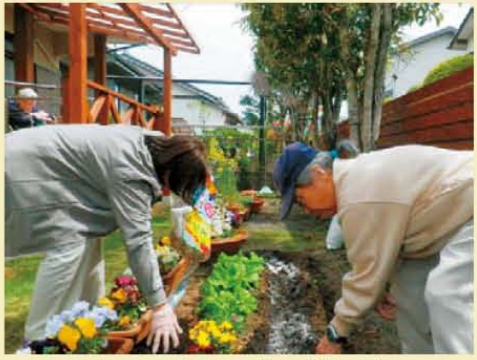
↑みんなでお庭にお花を植えました