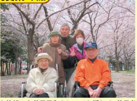
↑絶妙のお花見日和! とっても暖かく、花見弁当も食べて、のんびり楽しむことができました。