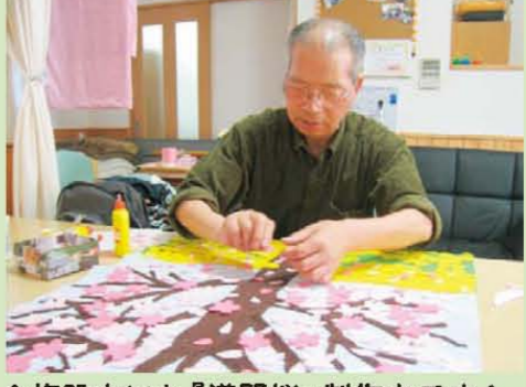
↑施設内にも『満開桜』制作中です!