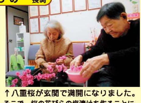
↑八重桜が玄関で満開になりました。そこで、桜の花びらの塩漬けを作ること...