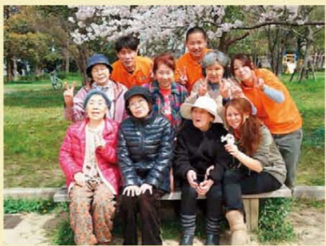
↑外出レクの花見♪ 集合記念撮影☆