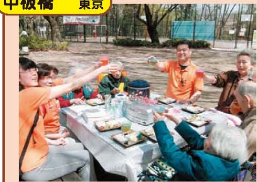
↑お花見最高!カンパ〜イ