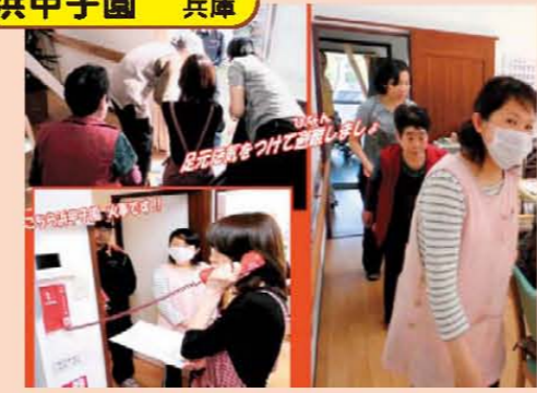
↑4月15日(月)浜甲子園で初めての消防訓練を実施しました! みなさん真剣に訓練しました! 『安全良し!!』