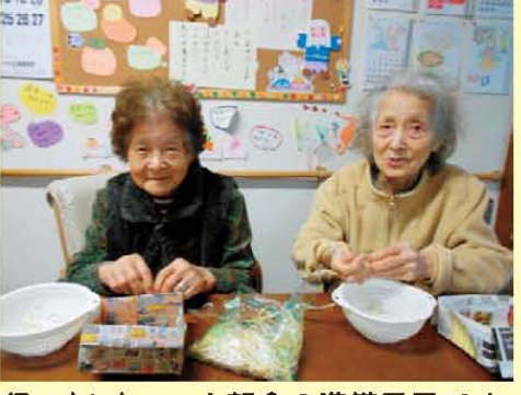
↑朝食の準備風景です。