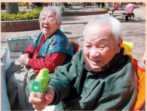
↑シャボン玉!久しぶりだよ(∩o∩)