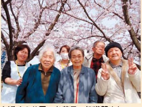
↑近くの公園へお花見。桜満開きれい~