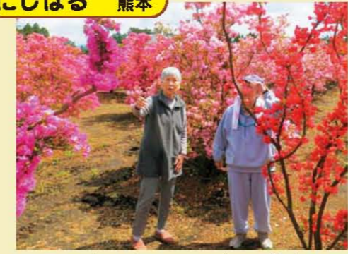
↑つつじ畑の中をのんびりお散歩♪