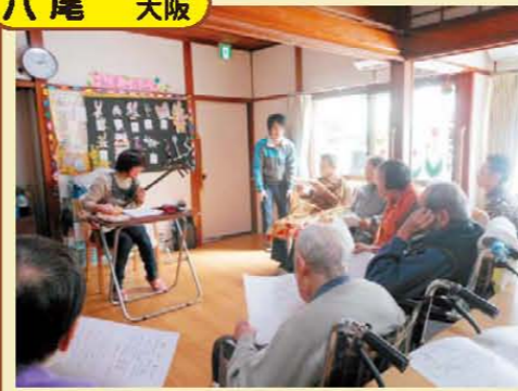
↑みんなで合唱しました♪♪♪♪♪