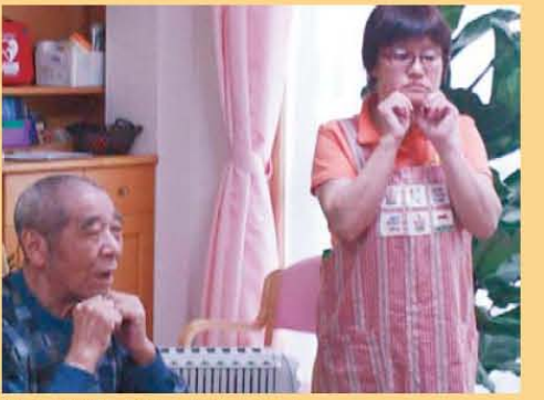
↑口腔体操しています。