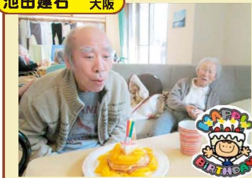
↑誕生日おめでとうございます!!