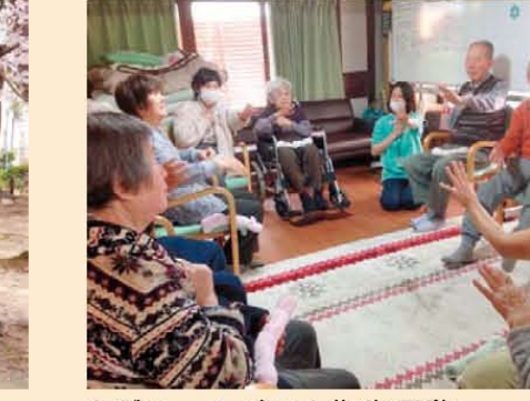
↑グツッ! パッ! 指先運動