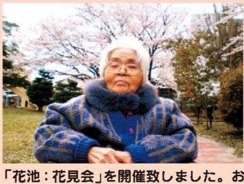
「花池：花見会」を開催致しました。お弁当を持って楽しい花見になり、「楽しい!・嬉しい!・ありがとう!」と皆さんの温かいお言葉を頂きました。