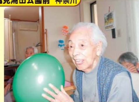
↑101歳でも風船バレーに参加できるんだぞお!!