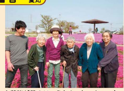
↑芝桜が花のじゅうたん。匂いもいいね。