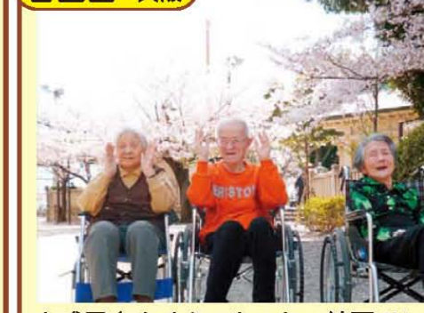
↑成田山さくら、めっちゃ綺麗でした