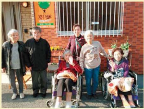
↑やっと暖かくなってきましたね!