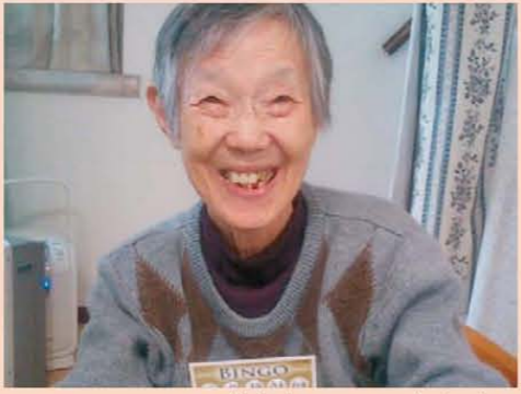
↑みんなでピンゴ大会をして盛り上がりましたよ♪素敵なプレゼントGET!!