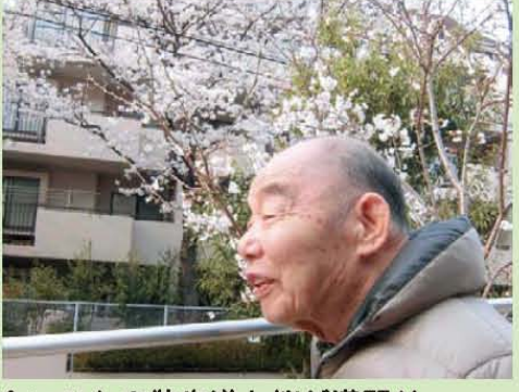
↑いつもの散歩道も桜が満開!!