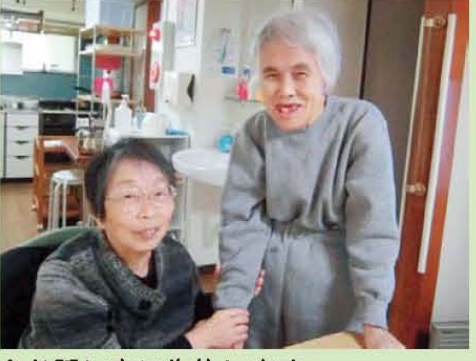
↑お話し中に失礼します