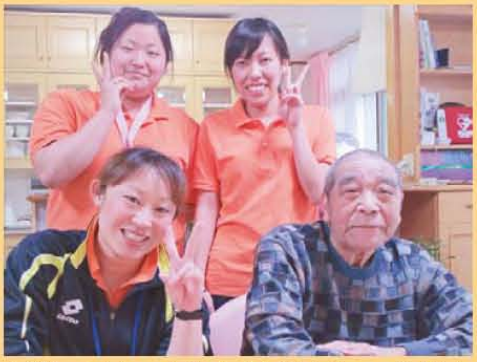
↑若いスタッフに囲まれてにっこり♪