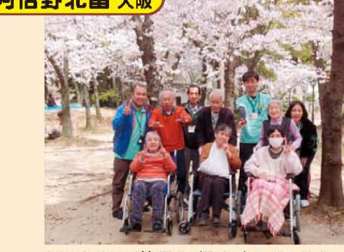
↑みんなで花見に行きましたよ♪