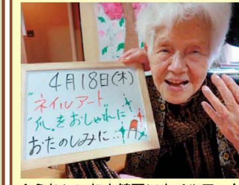
↑うれしいね♪綺麗にネイルアート