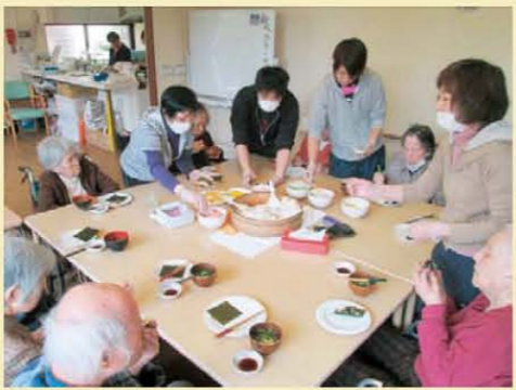
↑みんなで手巻き寿司パーティー♪♪