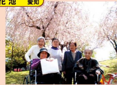
季節と共に心の中も春爛漫!