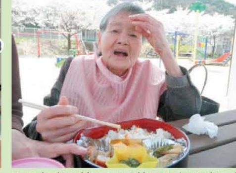
↑お弁当を持ってお花見に行きました