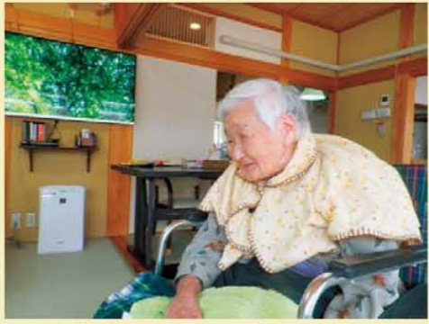
↑その笑顔のひみつを教えて!