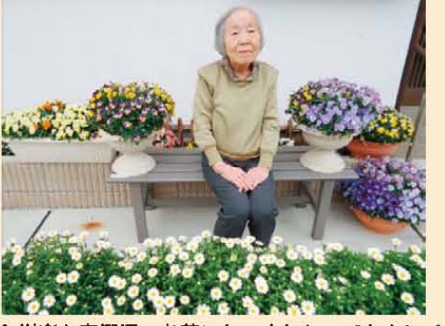
↑樹楽も春爛漫。お花にかこまれとってもキレイ