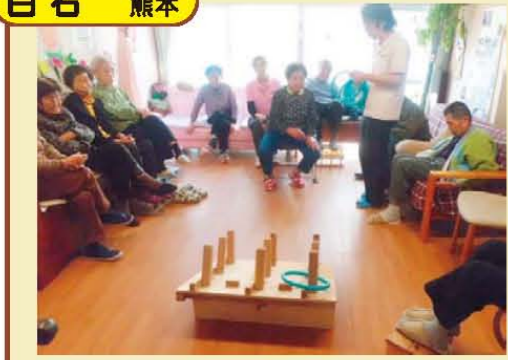
↑桜花の日 ゲーム大会(*∇^*)