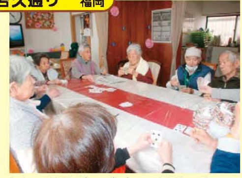
↑カード遊び ババア~はどこ?