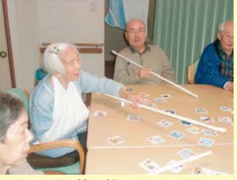
↑あった!! 棒を使ってカルタ取り