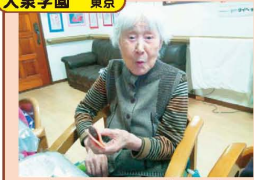
↑おやつを作ったよ o(∇^*)ノ