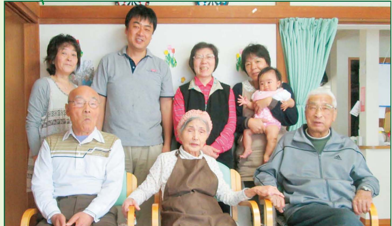
写真《利用者様とかわいいお客様と一緒に》樹楽「団らんの家」上大岡