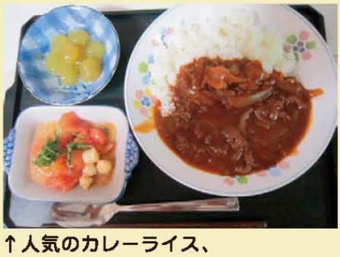
↑人気のカレーライス、 トマトと貝柱のマリネ、ぶどう