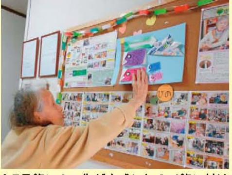
↑5月飾りの工作が完成したので飾り付けを行いました。