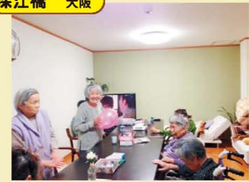
↑風船ゲームでこぼれる笑顔