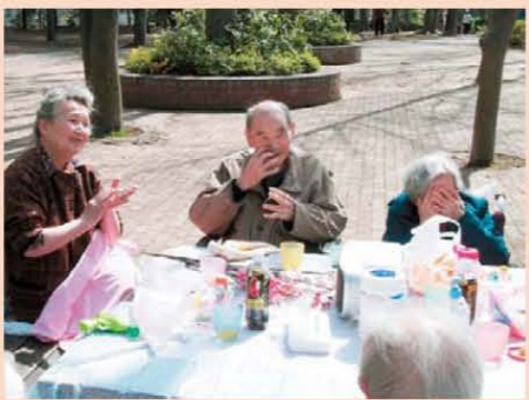
↑スタッフのダンスに大爆笑!!