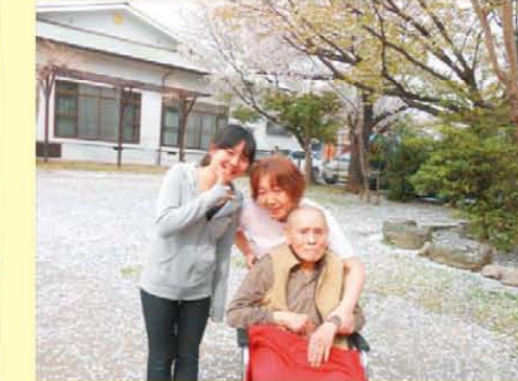
↑潮田神社にお花見に行きました♪