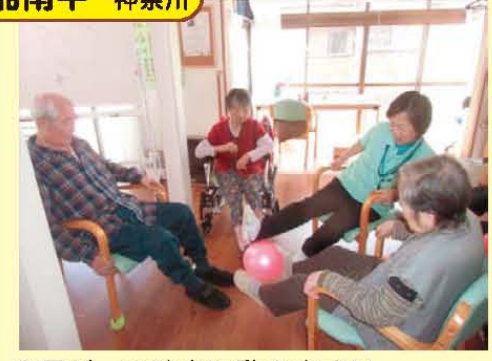
↑足だって達者に動きます!!