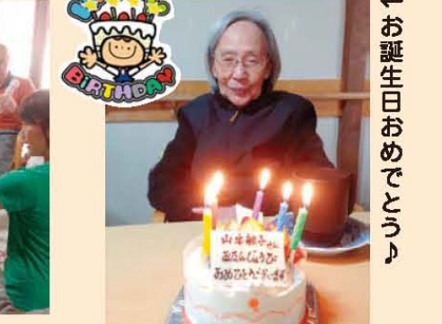
↑お誕生日おめでとう♪