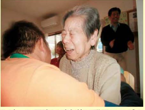
↑ゲーム優勝のご褒美は職員のハグ♪