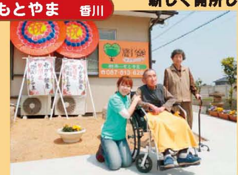
↑ようこそ! 樹楽もとやまへ