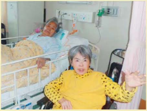
↑早く元気になってね!待ってます(・∇・)