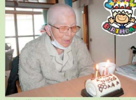
↑上田様☆祝! 米寿☆おめでとうございます