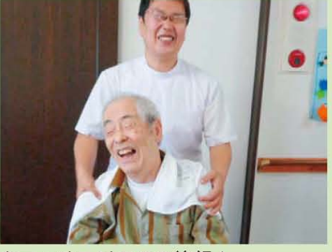
↑マッサージでこの笑顔!