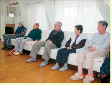
↑みんな同じカッコウ 右向け右!!