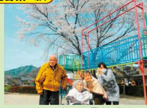
↑いい天気!! 近くの公園まで散歩