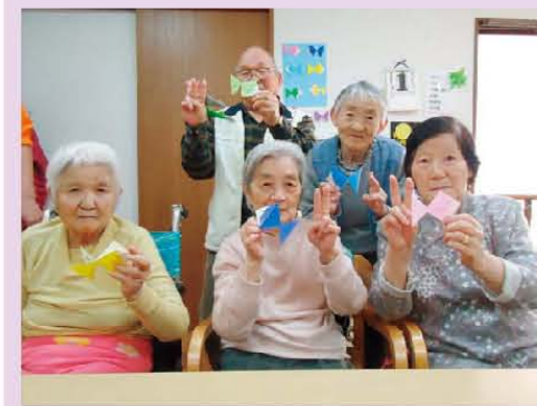
折り紙で各々のオリジナル金魚が完成！記念写真☆