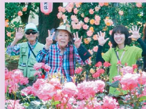
バラの香りに誘われて