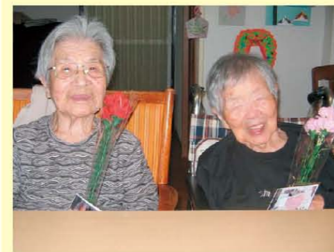
母の日にカーネーション。 素敵な笑顔です(*^▽^*)