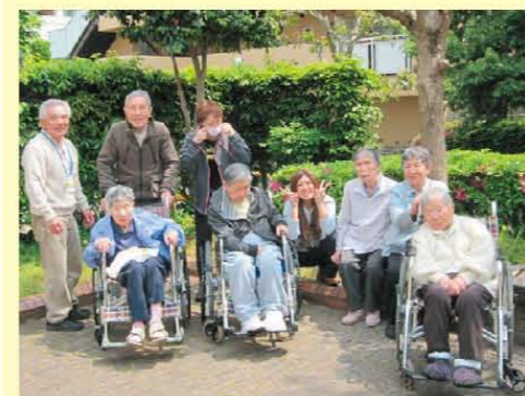
お天気ポカポカ、 みんなでお散歩しました！