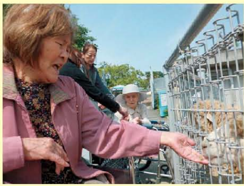
ひつじさん、餌どうぞ! ひゃ〜くすぐつたい!!