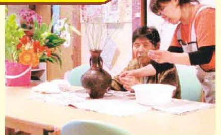
開店祝いで頂いた花を利用して 即興のいけばな教室開催の絵です。