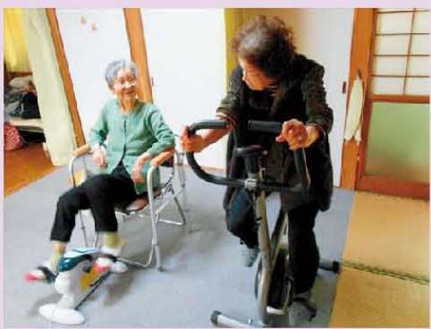
毎日の日課です。 「今日は、長崎まで行くよ♪」