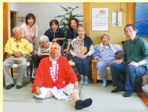
ひょっとこさんとはい、チーズ！