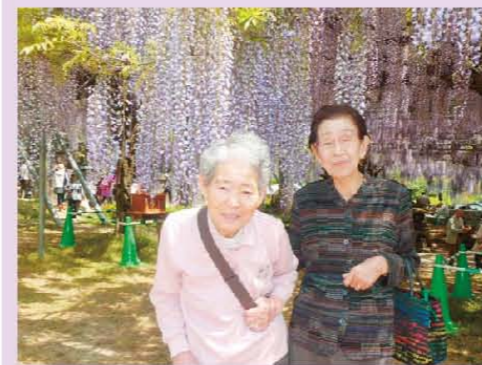
藤も綺麗ですがお二人もステキですよ！