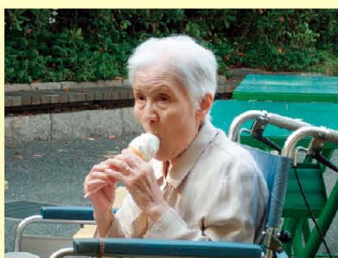
ソフトクリームが おいしい季節になりましたね