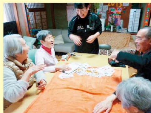
みんなでトランプ♪ あ～負けちゃった！もう一回！