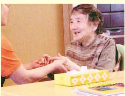
朝の体操風景です。利用者様の 楽しそうな笑顔が印象的です。