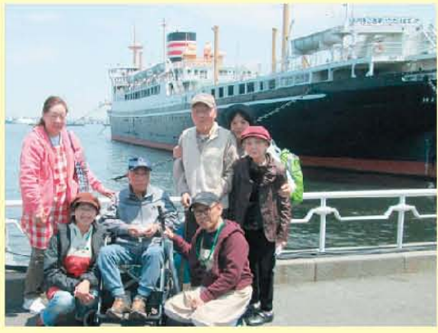
山下公園にピクニックに 行ってきました。