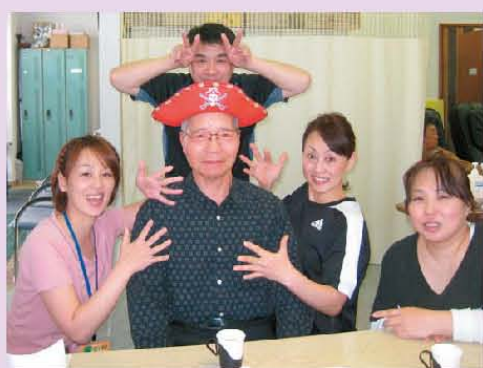
俺様はキャプテンハーロック! カッコイイ♥