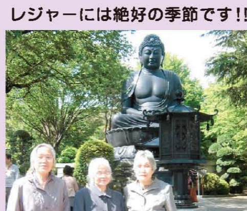
レジャーには絶好の季節です！！ 新緑の東京大仏で記念写真！！