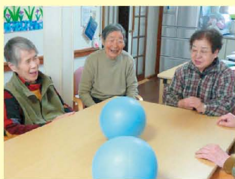
テーブルキャッチ! なぜか? 大うけです