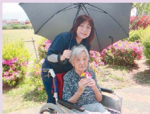
花束、作りました・・・!!!