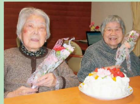
杉並宮前の 母の日の集いの様子です