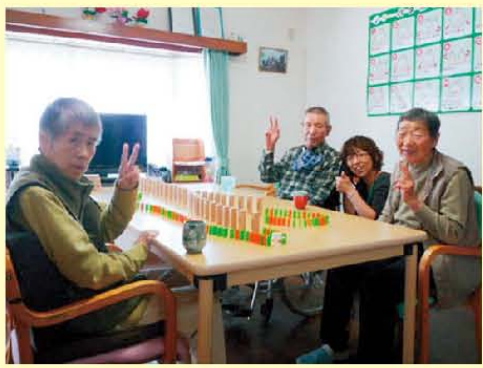
ドミノ! 成功しました!! 途中倒れても、くじけませんでしたよ