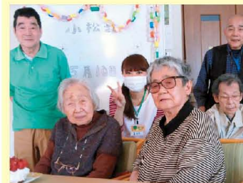
☆みんなでお誕生日会☆