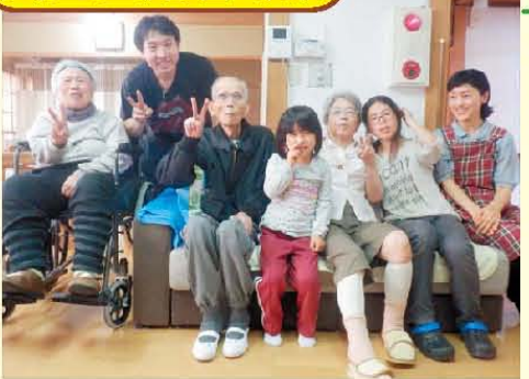
遊びに来てくれた子と みんなで1枚☆