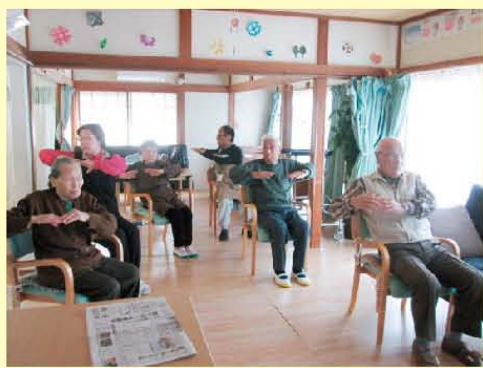
毎日欠かせません! 1.2.3と体操の時間です。