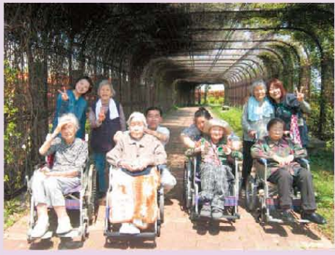
せせらぎの里に行ってきました。