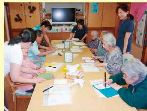
香里園の定例イベントの書道教室です。