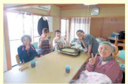
もんじゃ焼きパーティー \ (^o^ ) /