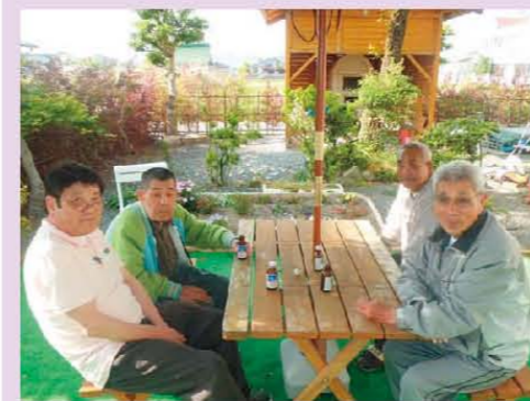
元気一発！ 男ばかりの喫茶店です♪