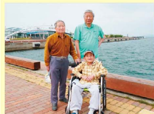
波止場に立つイイ男