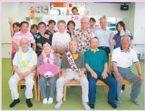
☆誕生日会☆ 『本日の主役』です!