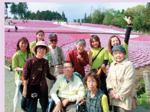
皆で仲良く芝桜を見学に行きました！旅行気分です記念写真♪