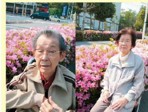
お散歩♪さつきが綺麗だったね