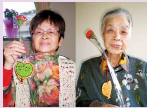
母の日に、お一人お一人に一輪のカーネーションをスタッフの気持ちを樹楽ちゃんカードにのせて、いつも笑顔で居て下さる皆様に感謝してお渡し致しました。