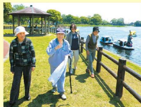
湖畔をゆっくりとお散歩