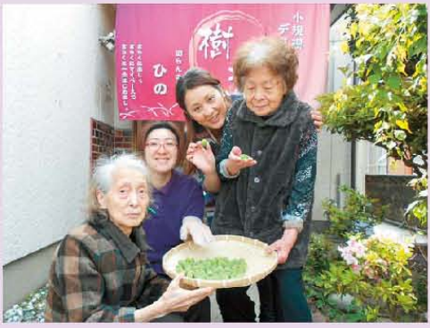
庭に梅の実がたくさん! 梅の実は、梅酢にしてみました。