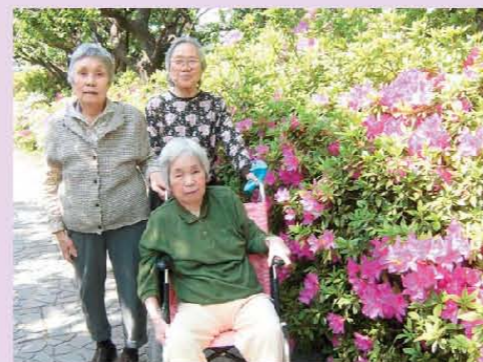
五月です。さつきです！