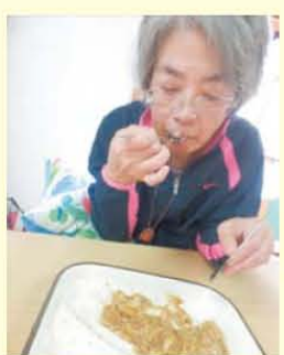
美味しく いただきました