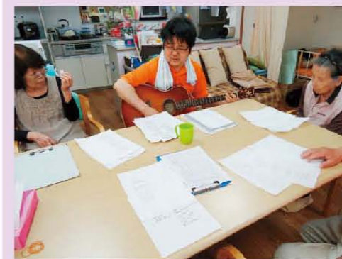
スタッフのギターで大合唱♪