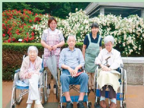
深大寺植物公園の バラ園を見に行きました。 とてもきれいでした!!