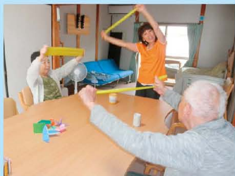
ゴム体操で 体の健康を保ちましょう!!