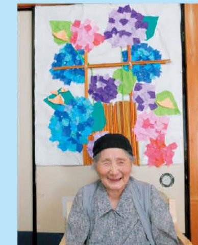
皆で作ったアジサイの前で ハイポーズ