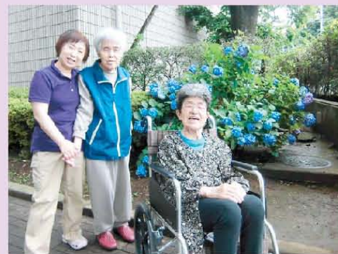
梅雨もいいですね