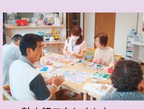
粘土細工をしました。 指先の運動にもなります。