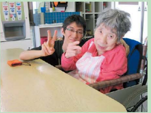
定期的に門真のフィットネスでしっかりと運動をしています！