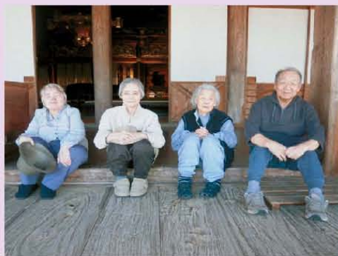
外出しました～ 近くのお寺さん(浄興寺)