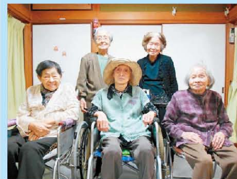
今から、お散歩に行きます。