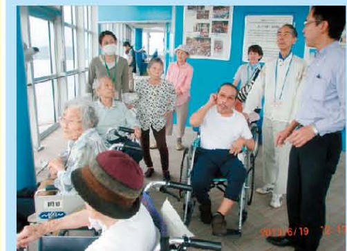
福岡タワー 120m やっぱり福岡はよかところばい!!