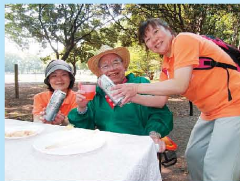
ちょっと飲み過ぎだな！