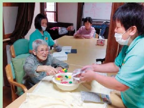
夏祭りに向け 猛特訓です♪