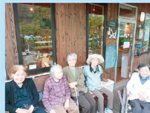
外出レクに行きました。 天気が良くて気持ちよかったですね