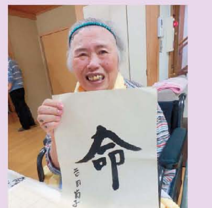
綺麗に書けました！