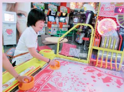
皆でお茶会を楽しみました