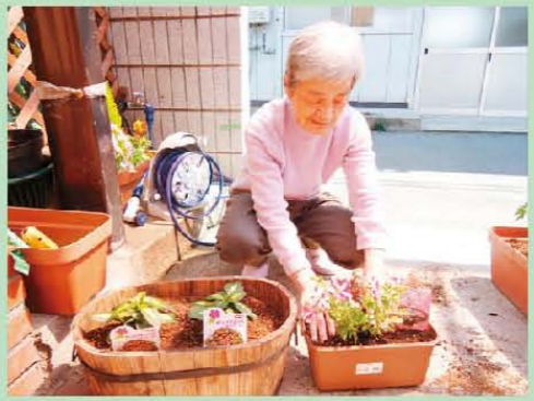
中島の玄関を色彩っている お花は、利用者様が 手入れをされています。