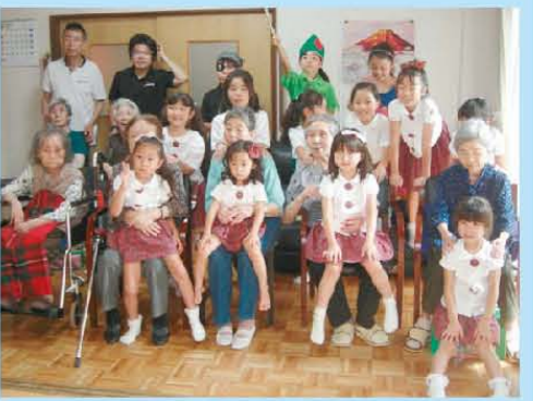
施設に子ども合唱団が慰問に 来たときのショットです。 とても素敵な日になりました。