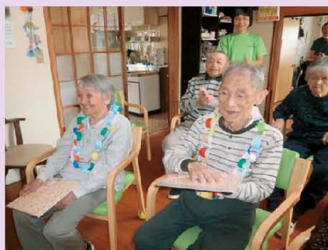
☆ 誕生日のイベント会 ☆