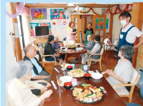
先月の6月に1周年を迎える ことができました。笑いあり 涙ありの1年でした。 利用者様・ご家族様に感謝です!