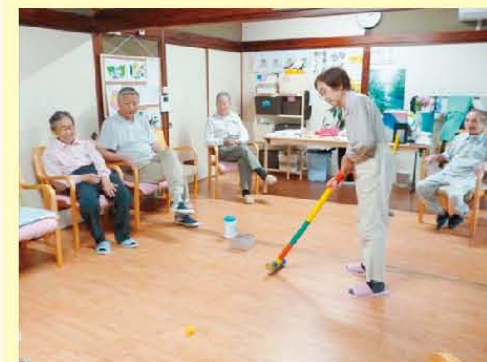
第1回 もとやまグランドゴルフ大会