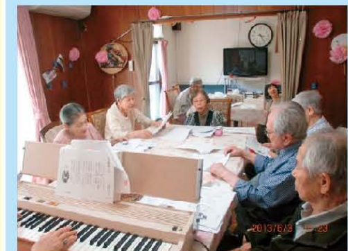
今日も歌声喫茶が 始まりました!