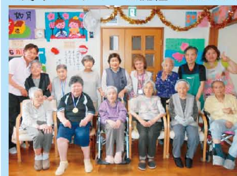
1周年パーティーを開催しました!