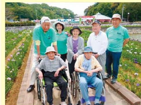
◎ 皆の笑顔満開 ◎