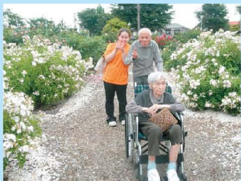
バラ館に行きました。 とても綺麗でしたね!