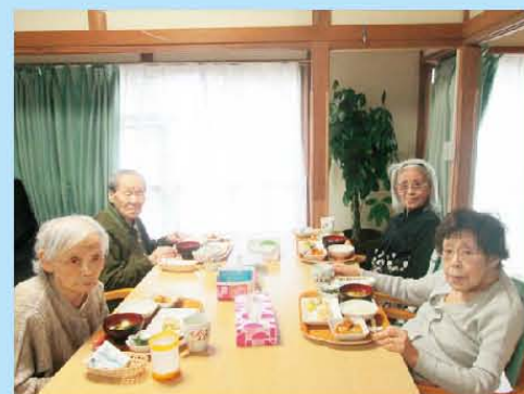
今日は女子会です。 話が止みません…(^▽^)(^▽^)