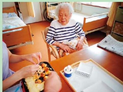
たこやき風ホットケーキを 作りました。おいしかったね♪