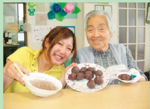
おはぎ作りをしました。甘さ控えめで上品なお味でした