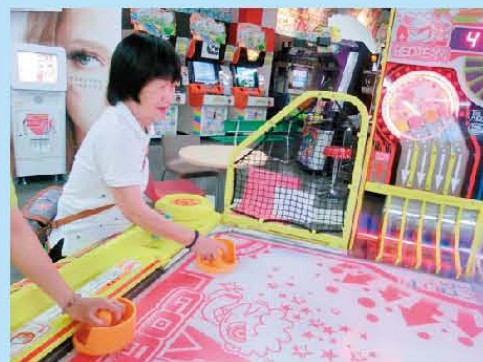
恒例のゲーム大会で 大はしゃぎ!!