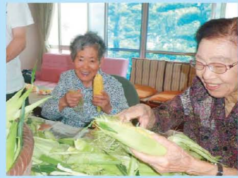
もぎたて新鮮○ 皮むき頑張り～(・▽・)b