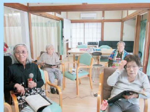
カラオケタイム♪ マイクは渡せません。