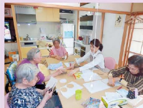
何を作りましょう？