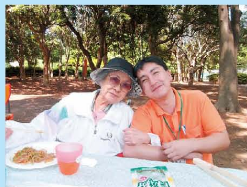
焼きそば！おいしい♡