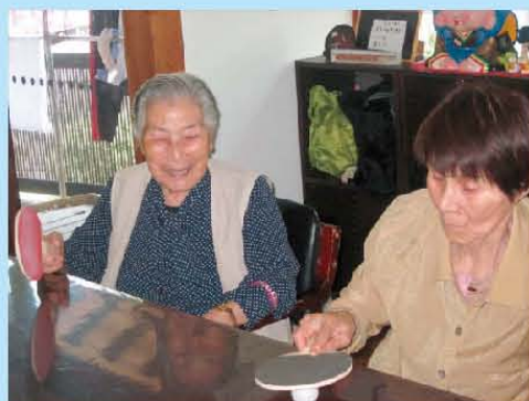
さあ！いくわよ！ ピンポンゲーム