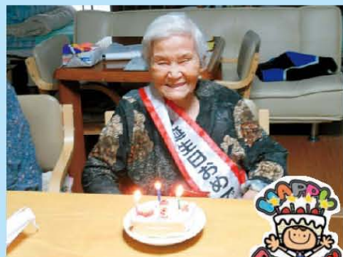
サツ子さん お誕生日おめでとうございます