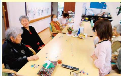
懐かしい「おはじきあそび」