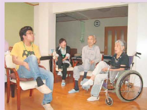
体操だ！モモ上げて、顔上げて 頑張って!!!