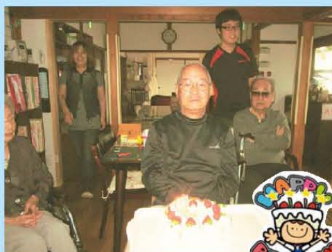
お誕生日 おめでとうございます