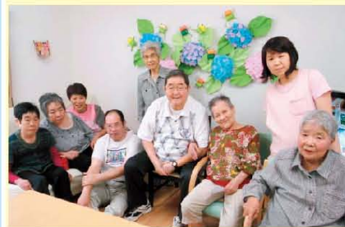
浜甲子園内の壁に 「あじさいが咲き乱れ」 みんなで記念撮影