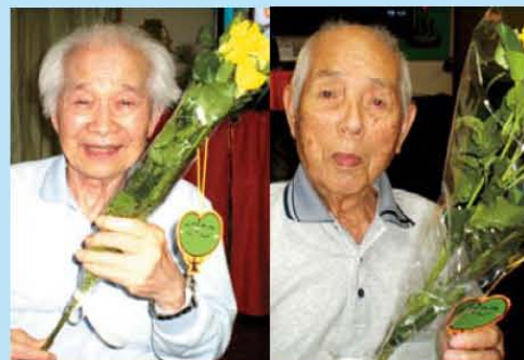
父の日に黄色のバラをスタッフの 気持ちを添えてお渡し致しました。 皆さん、お花を受取られ本当に嬉 しそうでした。 そのお姿に私達はパワーを頂いて おります。