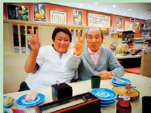
みんなで回転寿司に行きました。 やっぱり回転寿司は楽しいね♪