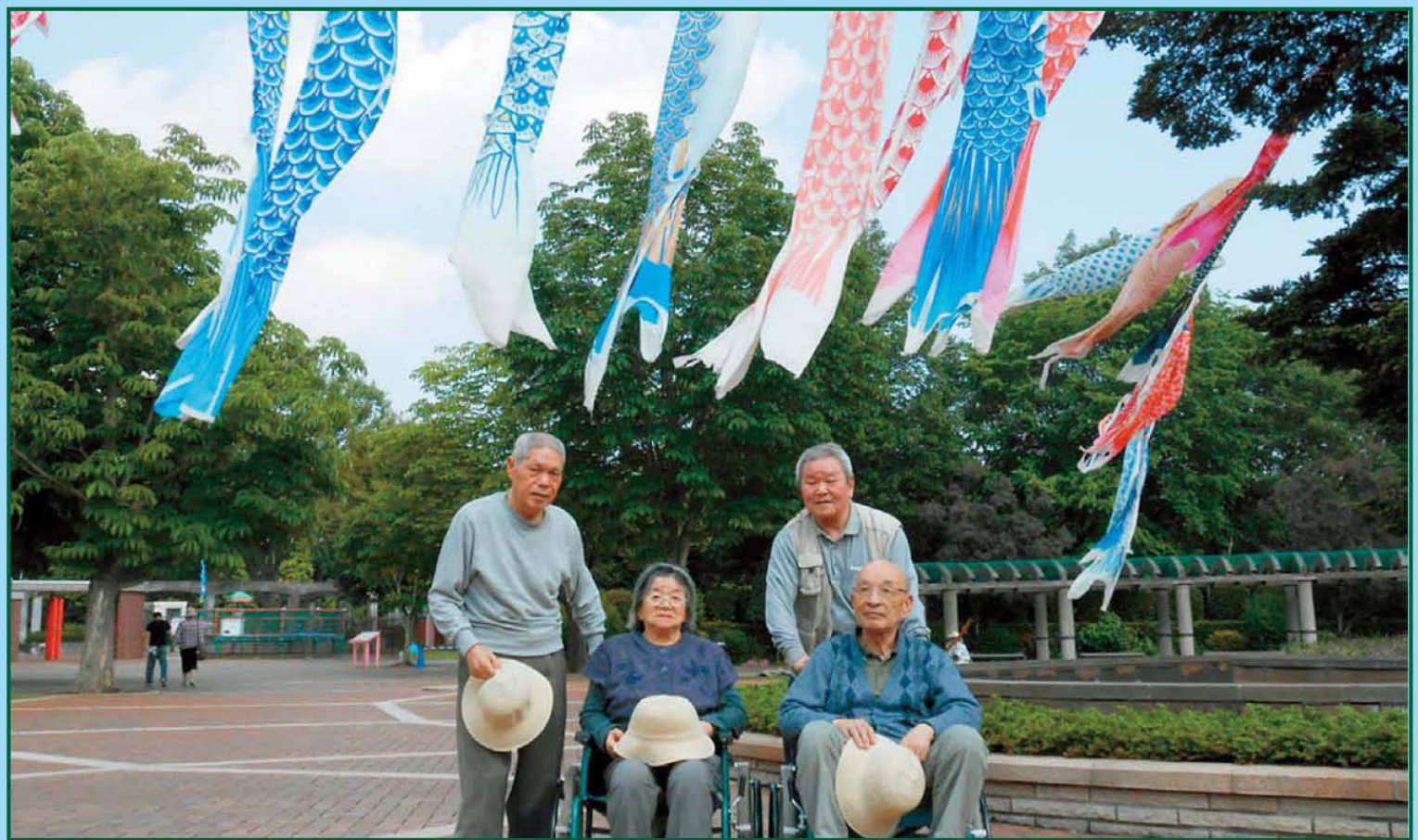
写真「春風の下で」樹楽「団らんの家」西の宮