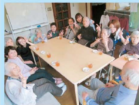
みんなでハイチーズ☆