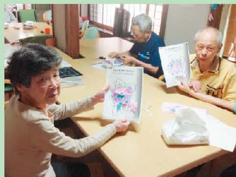
どう?見てみて うまくてきたでしょ!