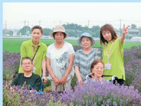
ラベンダーの 良い香りにつつまれて