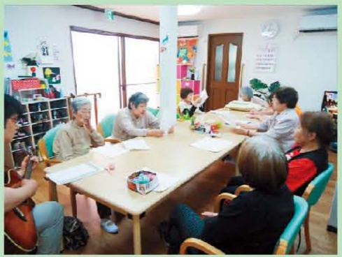
先月もいっぱい 歌いましたね♪