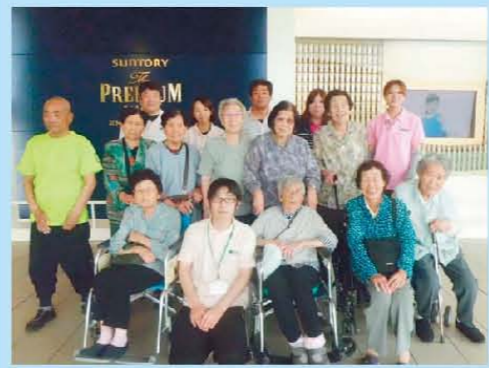
ビール工場にて。 すっかり試飲してきました☆ミ