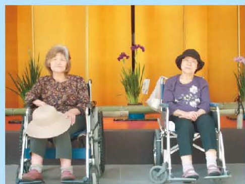
近くの菖蒲園の時の写真です。満開でとても綺麗な紫でした！