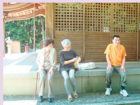
近くの神社へ お散歩に行きました。