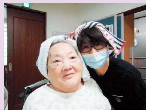
お風呂上り～♡ つやつや～♡