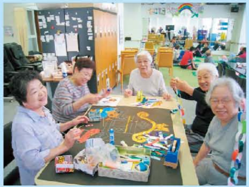
七夕飾りの準備中です♪ 今から七夕祭りが楽しみです。