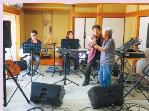
生バンドと一緒に熱唱♪