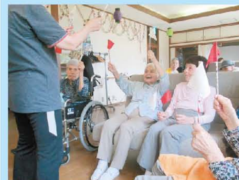
赤あけて♪白あけて♪ ♪♪♪♪♪♪♪♪♪♪