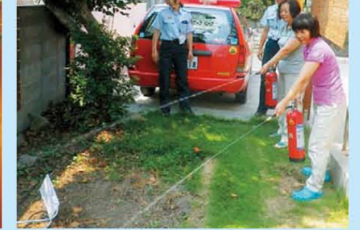
↑消防訓練を行いました。