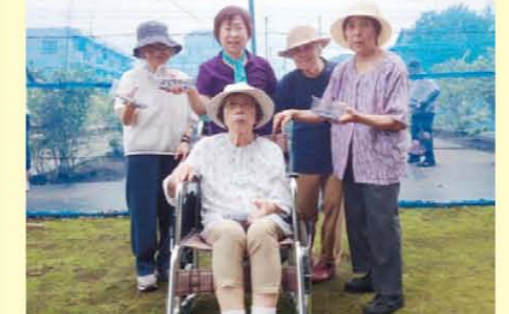
↑季節のブルーベリー狩りを楽しみました!