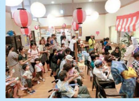
↑ピンゴ大会では100人以上の方が来ました!