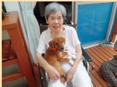
↑新しい仲間? 桜花? です