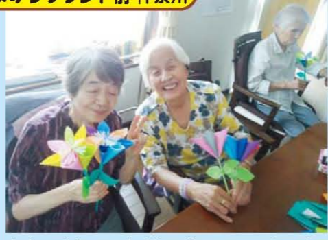
↑おりがみでお花を作ってみました。↑今日のおやつは手作りシャーベットです!