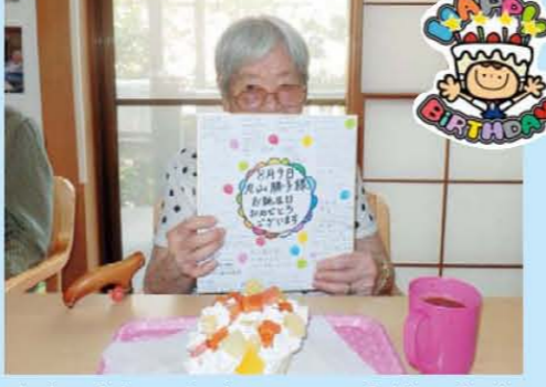
↑お誕生日おめでとうございます