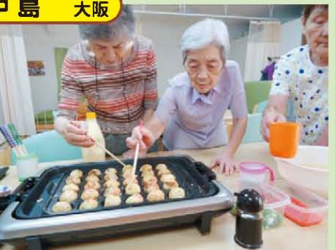
↑“くるっくる”上手でしょ