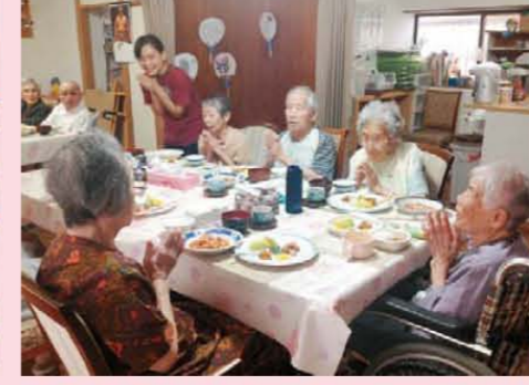
↑食べて食べて明日も元気で遊びましょう