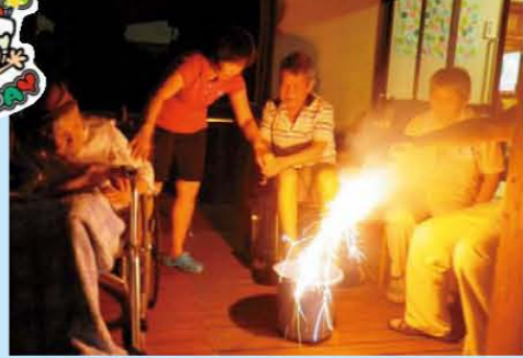
↑夏の風物詩と言えば花火!