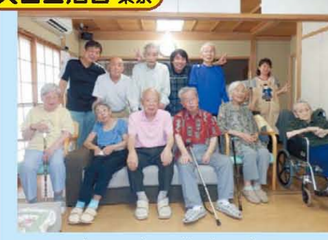
↑みんなで集合写真