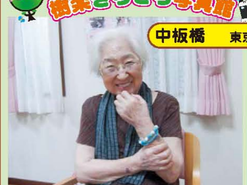
↑私の作品どうかしら(^v^)