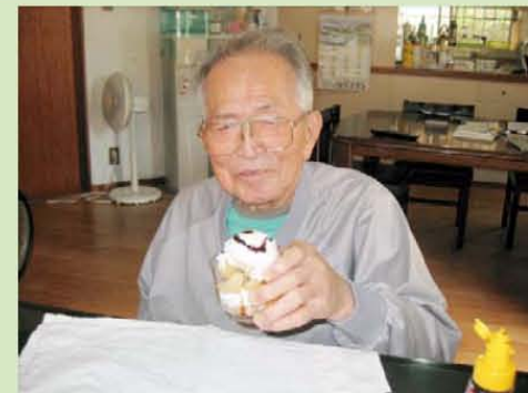
おいしそうにできたヨ(^o^)