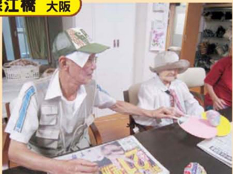
↑団扇で上手にボールを渡せるかな？