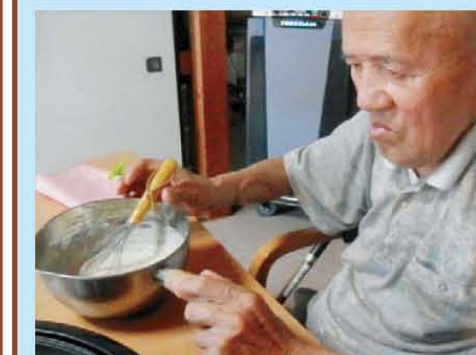
↑お菓子作りをしました