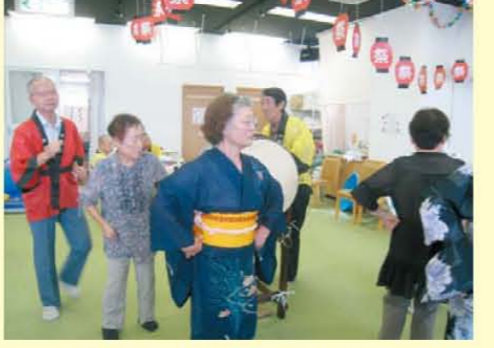
↑太鼓に合わせて盆踊り♪