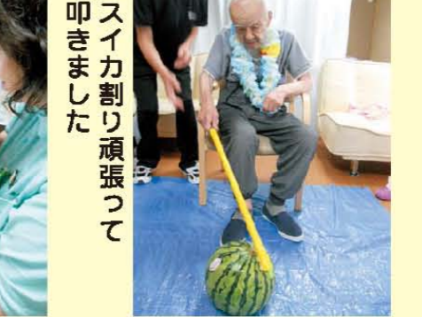
→スイカ割り頑張って 叩きました