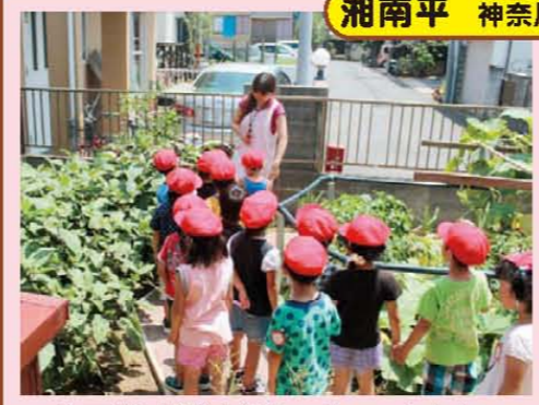
↑天使が我が家へやって来た