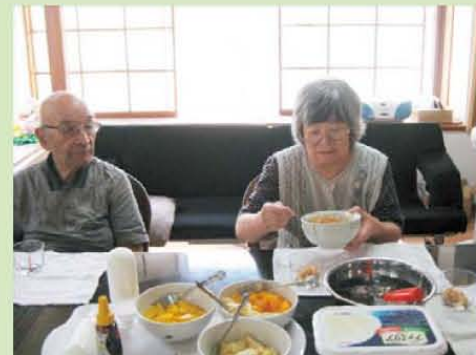
↑おやつ作りしました