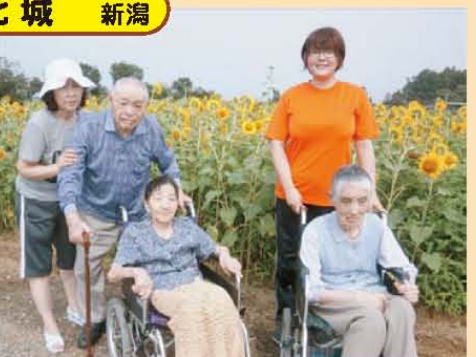
↑ひまわり満〜開!! (北新保へ)