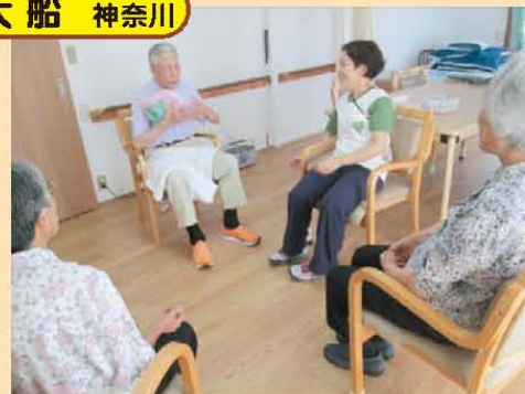
↑風船バレー大船大会