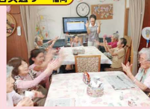
↑ワ〜っうれしいわたしの爪キラキラ指先美人に!