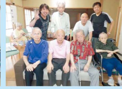
↑こちらの集合写真は男多いなw