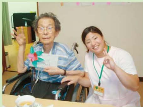
↑は〜い! カメラを見てね