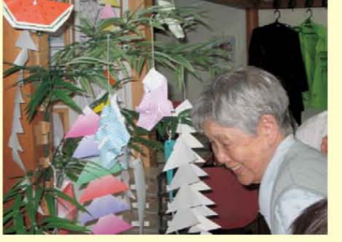
私市の七夕祭も盛り上がりました↑