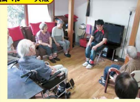
↑毎日の日課・午後3時半からの筋トレ風景です。