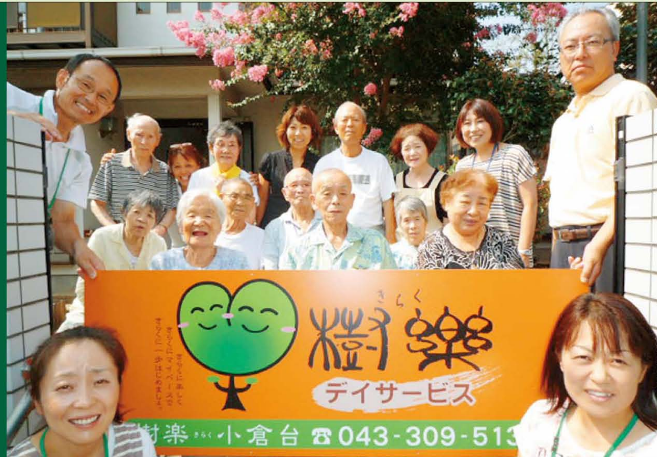
写真へみなさん! はい、チーズ! 樹楽 小倉台