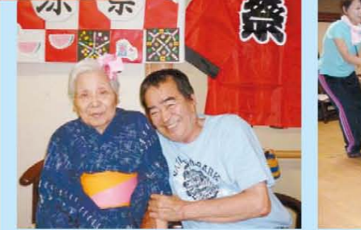
↑香里園の夏祭り☆☆☆みんな浴衣で楽しみました♪スイカ割やゲームも楽しかったね!