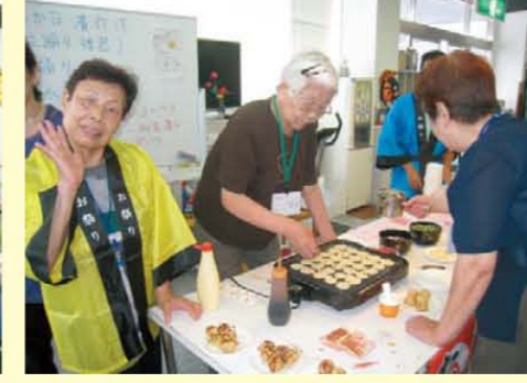
↑たこ焼きいかが?え?私がいい!?