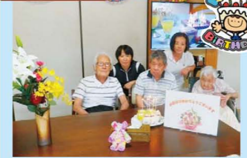
↑お誕生日おめでとうございます♪