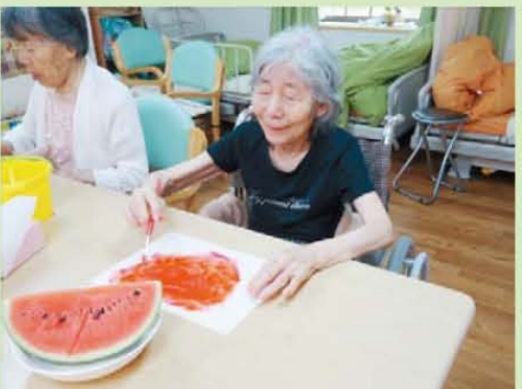
↑写生会。はやく…食べたいなあ〜