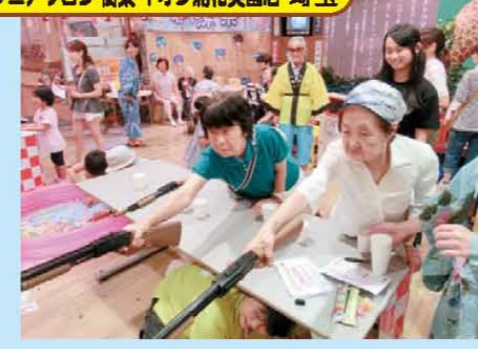
↑樹楽夏祭開催!! 射的で景品ゲット!