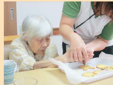
↑美味しいクッキー焼けるかな?