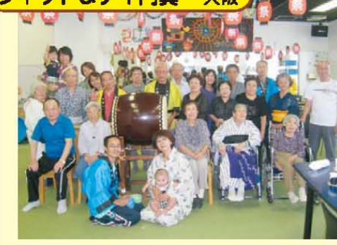
↑樹楽夏祭り!大盛況にて終了!