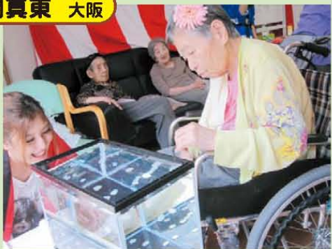
↑なかなか難しい! コイン落とし