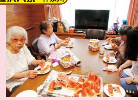
↑大量のスイカをベロリ♪甘かったね。