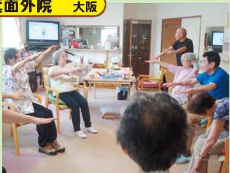
↑毎日欠かせない運動です!