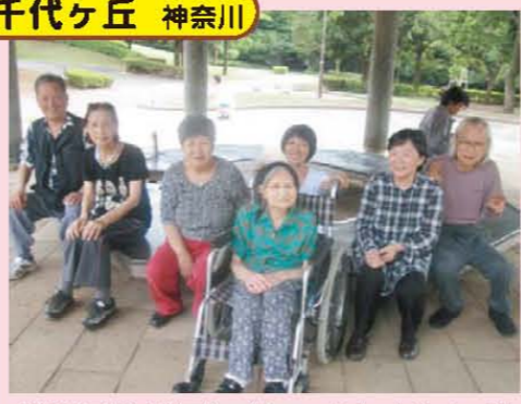
↑薬師池公園に行ってきました!!