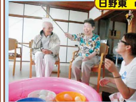
↑夏祭り! ヨーヨー釣り とスイカ割を行いました♪