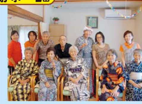
↑「何年ぶりの浴衣でしょう!!」夏祭り記念撮影