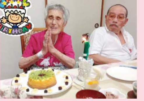
↑ありがとう、90年も生きていただきました