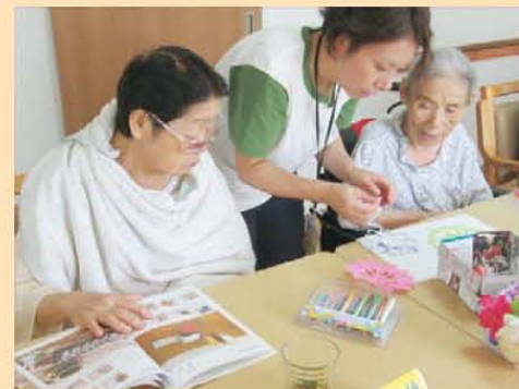
↑女子は可愛いものにめがないんです!