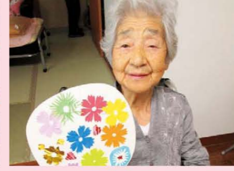
↑夏祭!ヨーヨーや金魚すくい...たくさんのゲームで楽しみました!