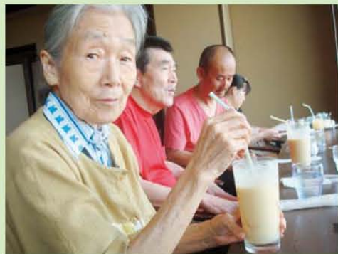
↑ミックスジュ〜チュ〜おいしい〜♪