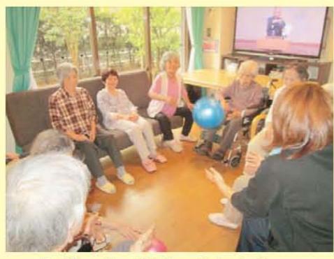
↑ボールで遊んでいますよ