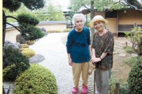
↑涼しげな日本庭園を散策中です↑