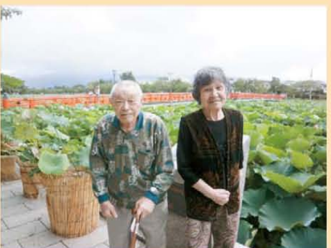
↑高田公園の蓮満開です!