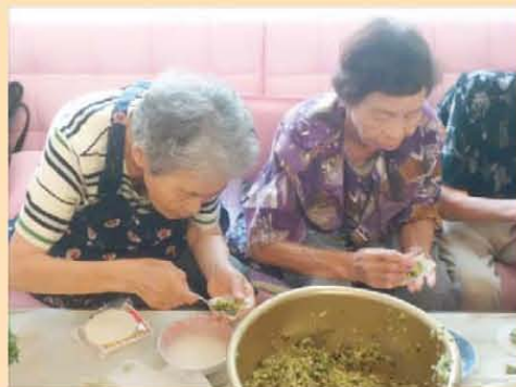
↑ギョーザ包むのはむずかしか〜