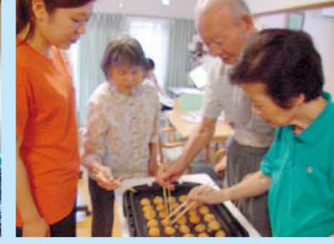
↑たこ焼きパーティー「自分で焼いた、たこ焼きはサイコーだね!!」