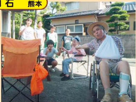
↑地域のお観音祭りで子供達と一緒に♪