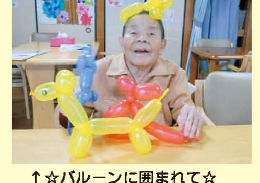
↑☆☆バルーンに囲まれて☆☆