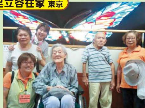
↑生物園: まだ行ってなかった利用者様でいきました。↑『夏の海』制作中。完成間近、ラストスパート! ↑ヤッター! 完成記念撮影