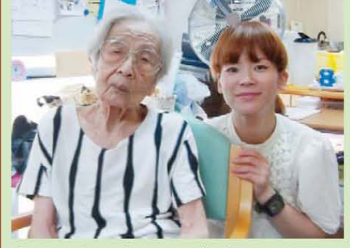
↑ヘアカットで10歳若返ったわ!!