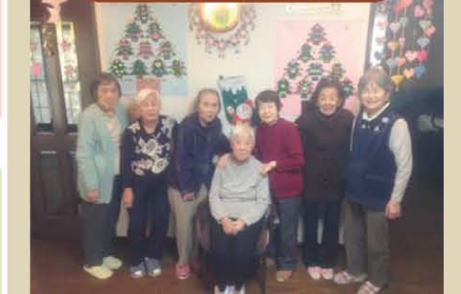
みんなでクリスマスの飾りつけ☆