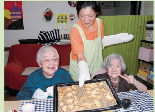
クッキー作りしました。( ^o^ )