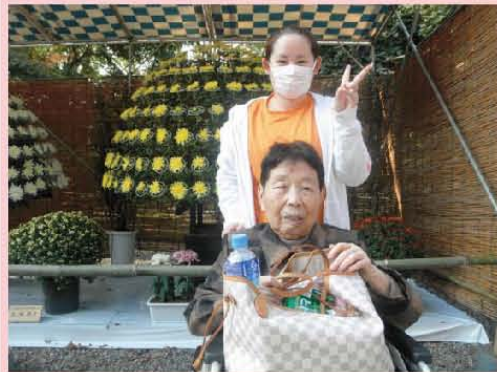
菊人形を見に行きました☆ 楽しかったよ (^U^ )人(>▽<)人(・▽<)v