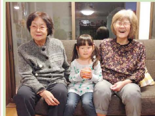
お孫さんとの写真撮影 「孫に足踏まれてる〜」