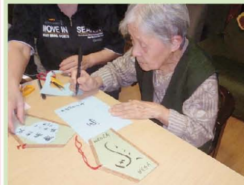
書道作品 来年の干支は「馬」