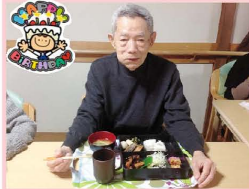
【誕生日のご馳走メニュー】 お誕生日おめでとうございます