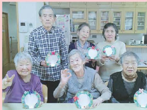
個別作成フォトフレーム! 楽しい思い出飾りましょ!