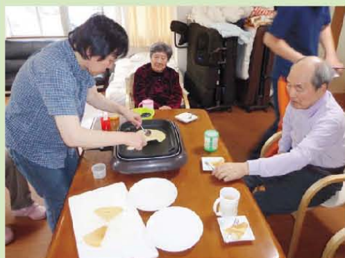
本場仕込みのチジミです!