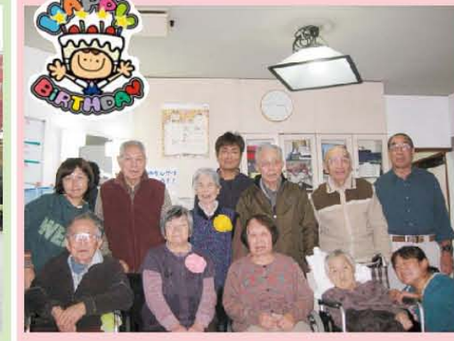
11月誕生日会 ☆集合写真☆