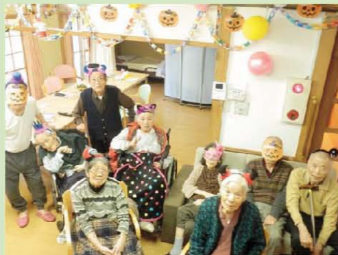
ハロウィン♪ みんなで仮装大会w