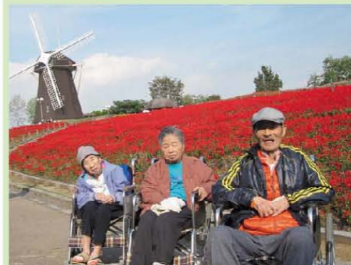
《外出レク》 紅いお花が満開でした