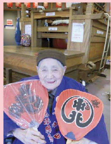
スエノさんだんじり姿でグ〜!