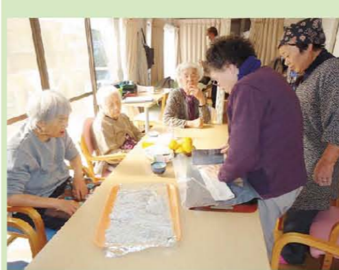
手打ち蕎麦をみんなで作り 美味しくいただきました!