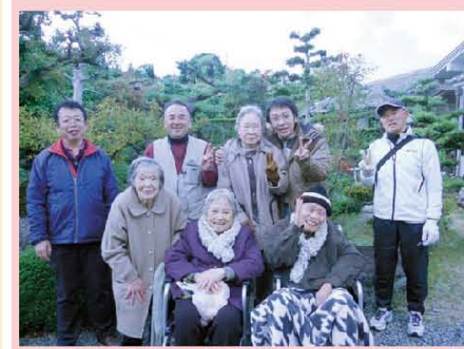
みかん狩りの帰り記念撮影