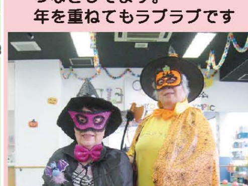
ハロウィン(正体は美しい魔女)