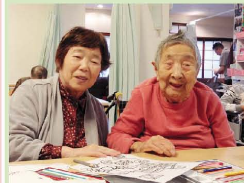
2人は、いつも仲良しです。