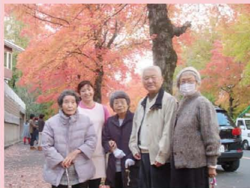
箕面の紅葉は すっごく綺麗です