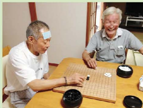
五目並べていざ勝負!!