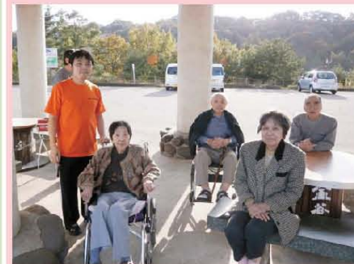
紅葉を見に お出かけしました。