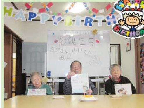
《11月お誕生日会》 皆さんおめでとうございます