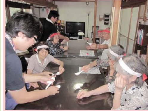
私市：秋の運動会の様子 白熱しましたね!!