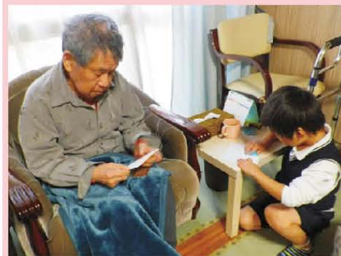
一緒に紙飛行機作り♪