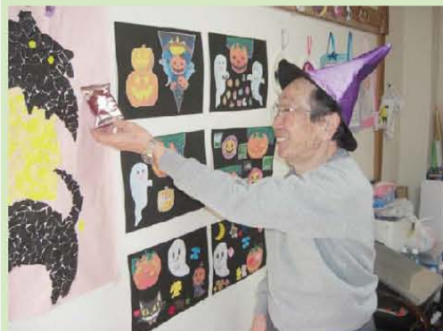
ハロウィンパーティーの ワンショットです。