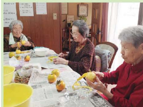
今年も干し柿作るわよ! がんばって!