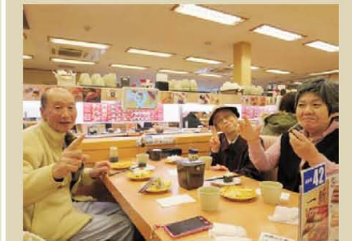
お寿司を食べに行きました