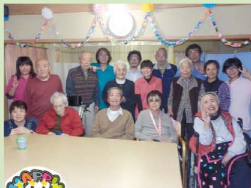
11月:文化祭&誕生日会