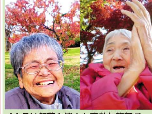
11月は紅葉を皆さん素敵な笑顔で 楽しみました! 肌で感じる季節はご利用者様お一人 お一人のパワーの源に! スタッフはご利用者様の笑顔を源に! 共に毎日素敵な日々を過ごしています。