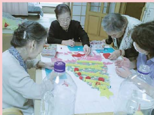
ロールアート作成中! 乞うご期待