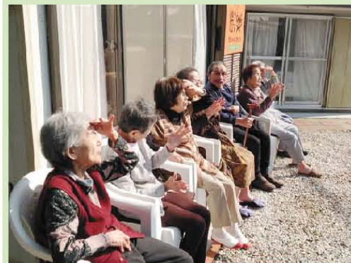
お日様は暖かいよね! まぶしい~