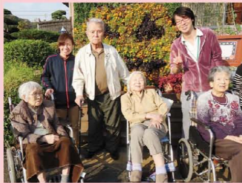
お散歩で フラワーセンターにいきました!