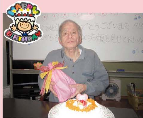
人生、これからだ! BY 湯川!