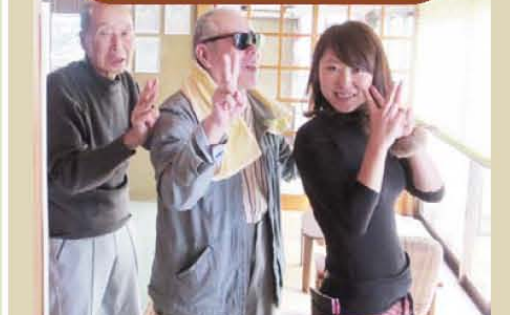
みんなで歩行訓練