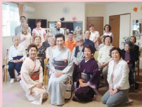
踊りの先生達と記念撮影です 美しい歌と踊りを堪能しました