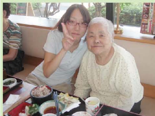
レストランで外食しました。 まんぶく♪