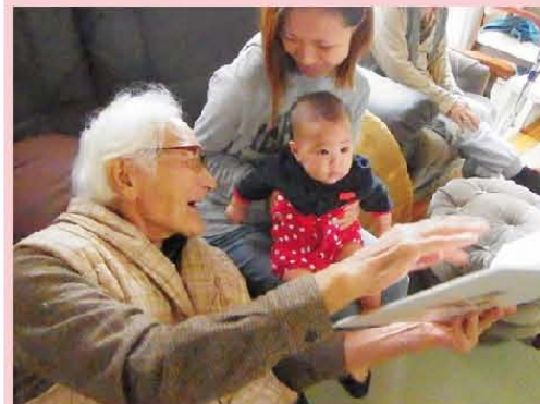
早く絵本が読めるといいね!