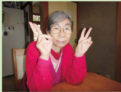
笑顔がチャーミングな 宣子さん♡