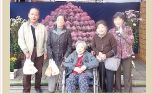
高幡不動に行きました