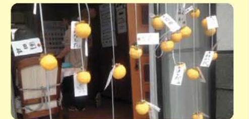
↑「わたしのどれ〜」 樹楽 若久通りの干し柿

11月の樹楽では、ハロウィンパーティーや食欲の秋、紅葉の鑑賞、クリスマスの準備などで盛り上がりました♪