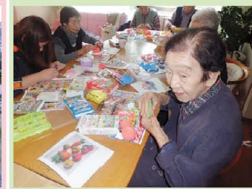
みなさん上手ですね〜☆