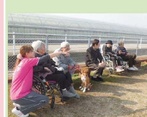
日向ぼっこ & ゲートボールの応援!!