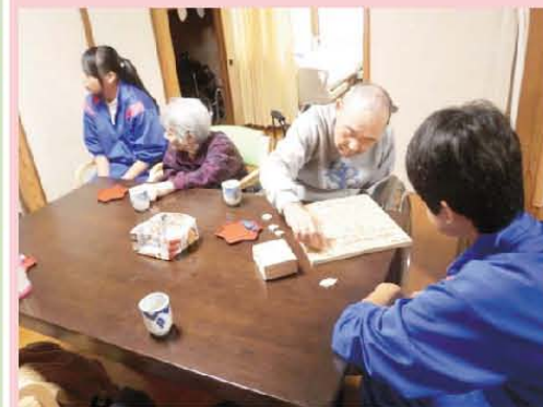
中学生が 福祉体験に来てくれました。