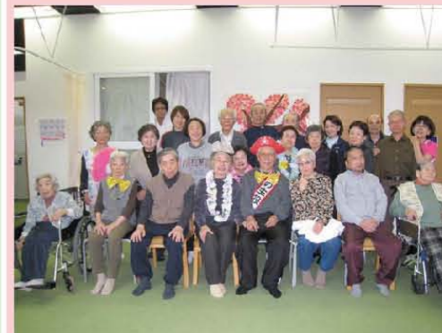
誕生日会 隣りは奥様です。手を恋人 つなぎしてます。 年を重ねてもラブラブです