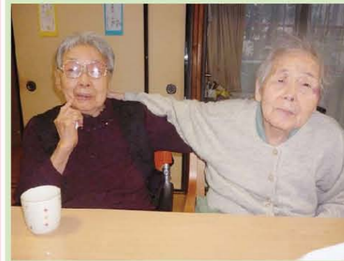
さあさあ! いっしょに写真撮ろうよ!