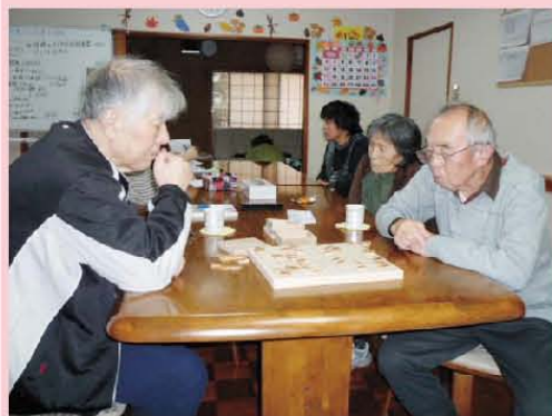
ムムム…! そうきたか!!