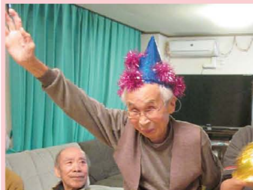
みなさんありがとう~?