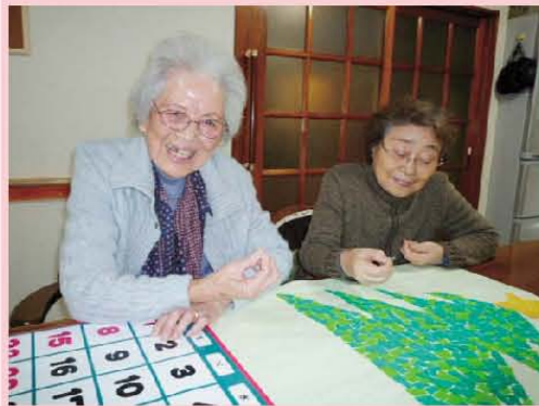
みんなで12月カレンダー 作成中です