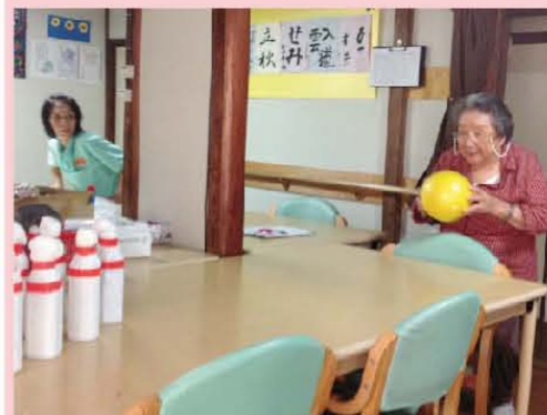
【レクリエーション・ボウリング】 さあ、よく狙って!