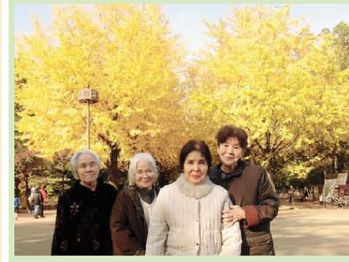
イチヨウ並木が見事です!