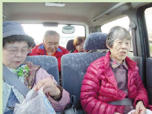
車にて大きな公園に向い 歩行訓練をしました