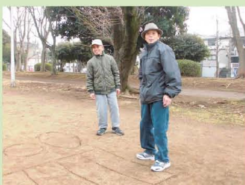
皆さん元気! 集中です