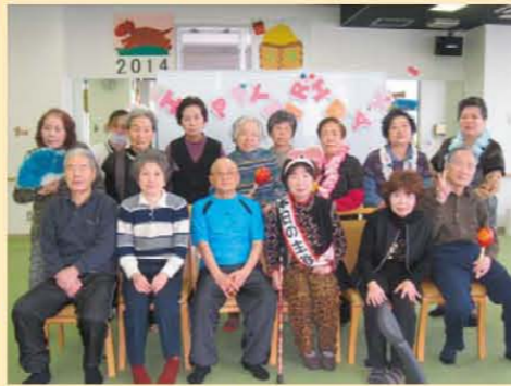
お誕生日会 「今日は私が主役」