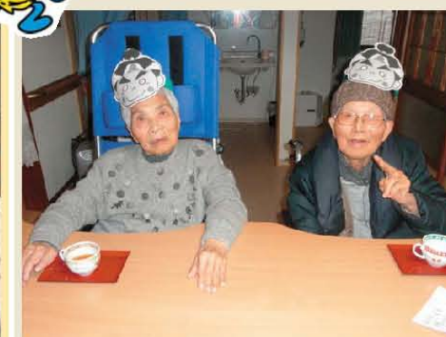
節分 (^o^) お面を作ったよ☆