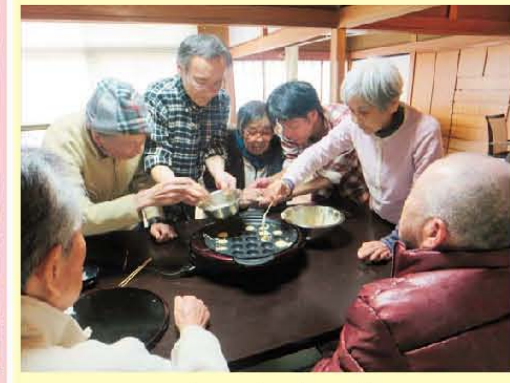
みんなでおやつ作り