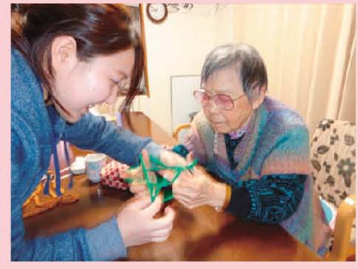
あやとり「そうそう」