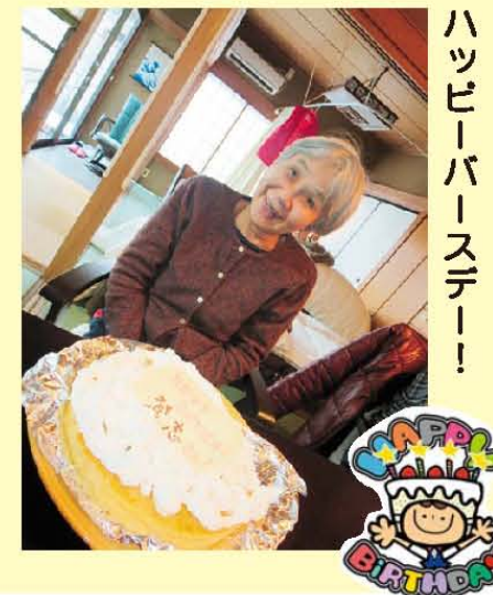
ハッピーバースデー!