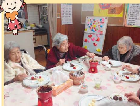
2月14日は…甘い～甘い～ チョコいただきました。