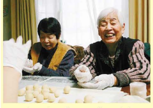
クッキー作ってま〜す♪