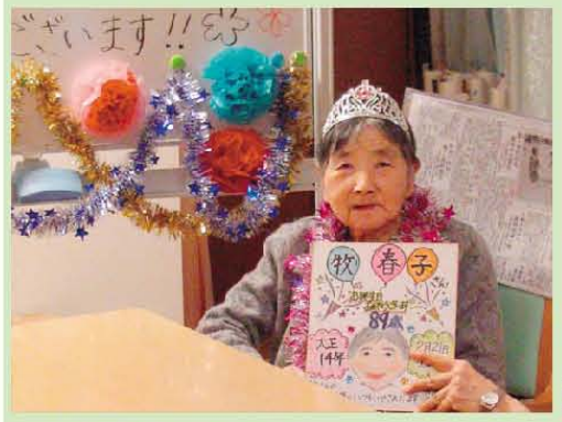
満89歳の誕生日です。