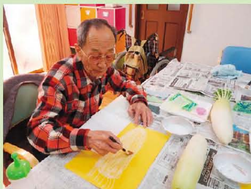
臨床美術 と 節分イベント