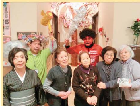
鬼と福の神を交えて記念写真