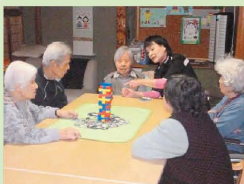
さあさあ! ジェンガ大会始まるよ～♪