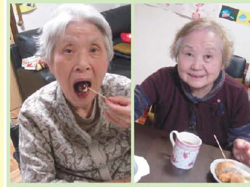
バレンタインパーティー (チョコフォンデュ)