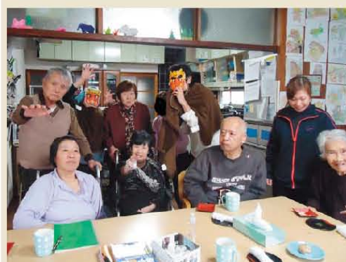
鬼は外、福は内～! 節分豆まき!!