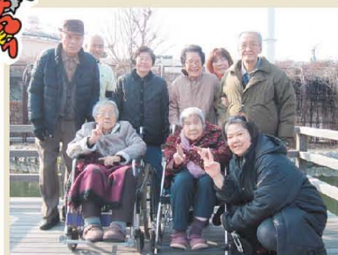
散歩! みんなと一緒になら寒くない!