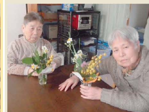
フラワーアレンジメント(^o^) 綺麗に作れたよ～