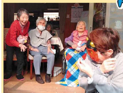
2月3日 「鬼は外!、福は内!」