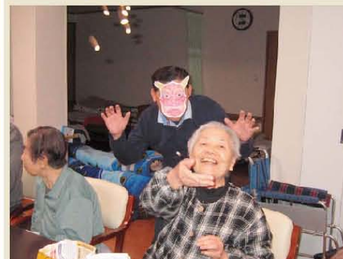
鬼は外～!! 福は～樹楽 深江橋!!