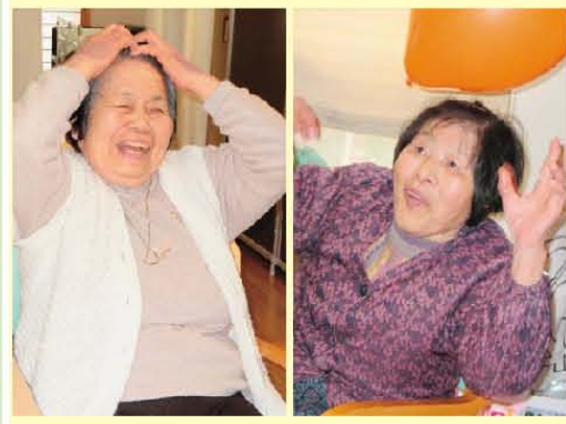
風船バレー 「あ〜しっばい!」「よいしょっ☆」