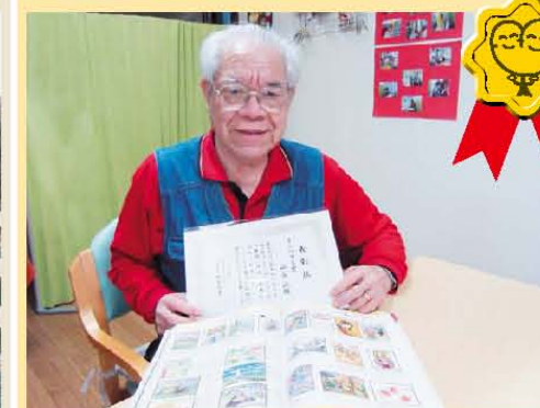
「月刊デイ」ぬり絵コンクール 入賞おめでとう!!