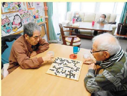
毎日、勝負が日課です(´▽`) 「牛若丸」の歌が大好きな96歳