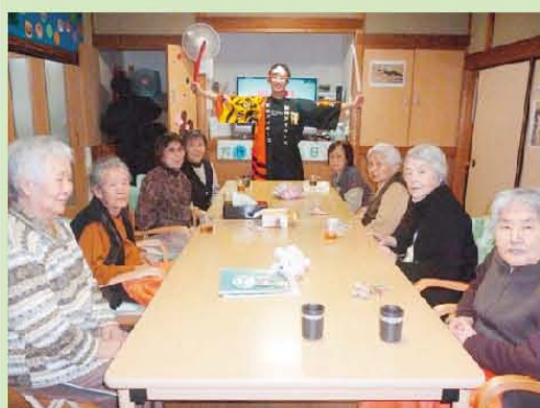
豆まきで鬼退治! 桃太郎とハイ、チーズ♪