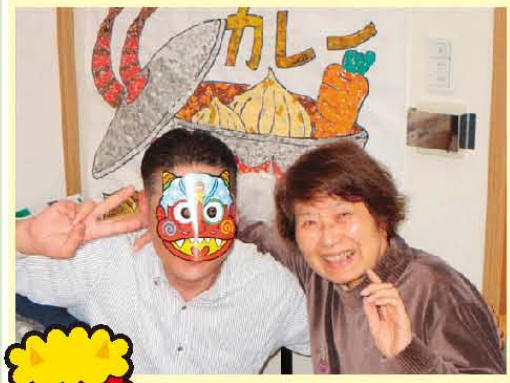
節分「鬼となかよし」