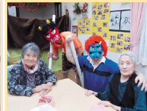
豆まき! 楽しかったね!