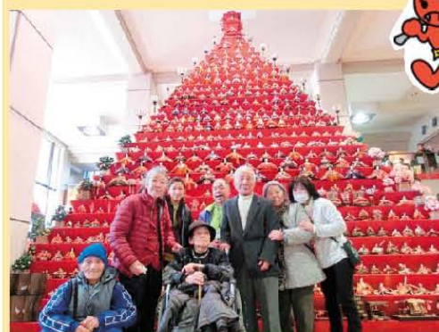
今年も日本一の雛壇を 見に行きました!