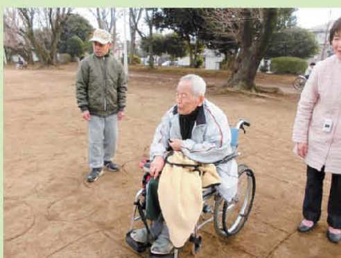
寒くても… 公園で陣取りゲーム!!