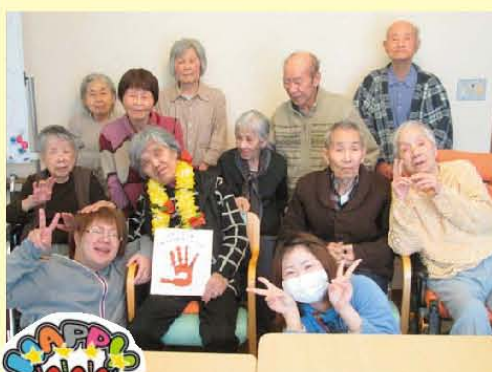
今日は私が主役です (#^ ^#)