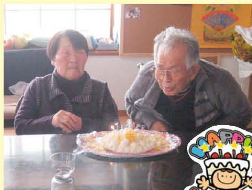
お誕生日 おめでとうございます!